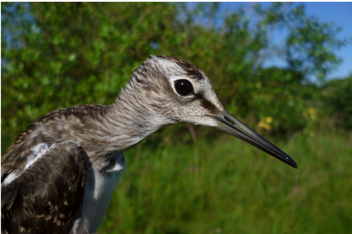
Afbeelding 12. Bosruiter, juveniel, Meijendel, Wassenaar, 3 augustus 2013

Dit jaar werden drie Grote Bonte Spechten geringd. Twee schaarser geachte familieleden waren daarmee beter vertegenwoordigd dan de algemeenste soort in Nederland én Meijendel. Kleine Bonte Specht bracht succesvol jongen groot rondom de ringbaan. Ze werden zeer regelmatig