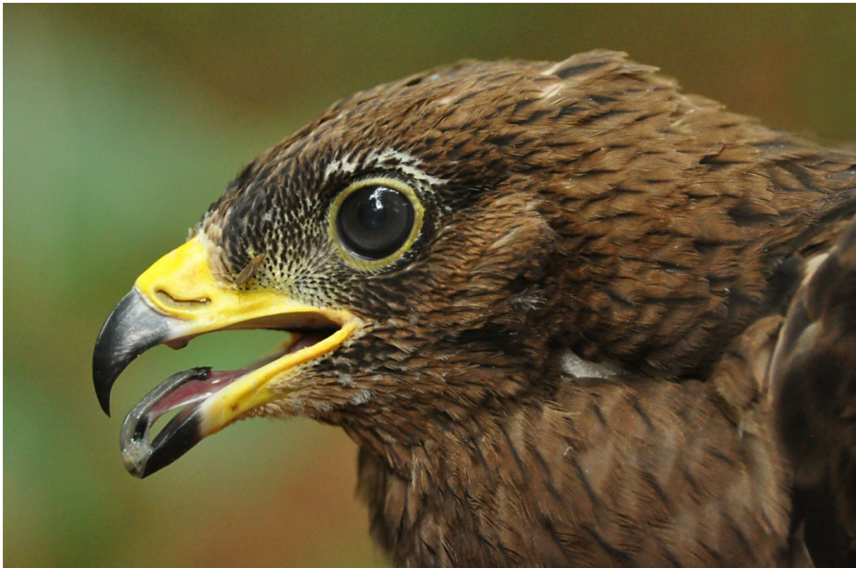
Afbeelding 22. Wespendiff, juveniel, Wassenaar, 5 augustus 2013: vermoedelijk de tweede Wespendiff die ooit in Zuid-Holland geringd is.

Buiten Meijndel werden alleen de Bokjes structureel geringd (RAS), de overige vangsten waren incidenteel. Het onderzoek naar Bokjes dat in 2009 is opgestart werd voortgezet in de Duivenvoordse Polder. Eindelijk was er een terugmelding: een op 11 november 2012 door ons geringde vogel werd op 18 november 2013 geschoten in noordwest Frankrijk. In totaal werden slechts zeven Bokjes geringd. Er waren liefst twee vangpogingen met nul vogels: in de voorgaande jaren was pas eenmaal eerder een nulvangst voorgekomen. Ook hier een mager jaar derhalve! In Den Haag en Leiden werden enkele pullen van dakbroedende meeuwen geringd, in totaal zes Kleine Mantelmeeuwen en drie Zilvermeeuwen. In Noordwijk werden op verzoek vier nestjongen van een Torenvalk van metaal voorzien. Bijzonder was de jonge Wespendiff in Wassenaar. Het betrof vermoedelijk het eerste nestjong dat ooit in de provincie werd geringd; de enige andere (betrouwbare) ringmelding betreft een adulte vogel uit Vogelklas Karel Schot, het vogelasiel in Rotterdam.