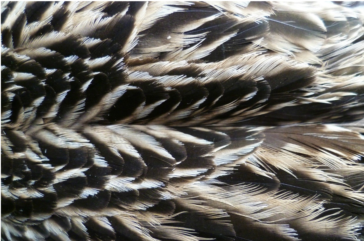
Afbeelding 6. Rug- en schouderveren van een Wulp, Meijndel, Wassenaar, 22 januari 2013.

Op de 17 e werden twee Grote Lijsters gevangen, ook al een dagrecord. De laatste vangst van deze soort dateerde van januari 2010. De eerste Buizerd sinds 2010 werd op de 16 e geringd. Er werden in deze periode vier verschillende, reeds geringde Gaaien teruggevangen. Twee daarvan waren ouder dan vijf jaar. Later in het jaar zouden nog twee Gaaien geringd worden. In tegenstelling tot de vorige twee sneeuwperiodes (februari 2012; december 2010) waren er maar weinig Stormmeeuwen . Ondanks herhaaldelijke pogingen werden er maar 15 gevangen, waaronder een 3 e kalenderjaar met een Helsinki-ring op 22 januari. Steltlopers en Veldleeuweriken lieten het behoorlijk afweten. Van de laatstgenoemde soort werden er slechts zeven gevangen. Daarbij bevond zich een terugvangst van een eerder op die dag door VRS Van Lennep geringde vogel. Op 20 januari kwamen wel twee Wulpen binnen (en ontsnapten er nog eens twee door een technische mankement) en op de 22 e was er een terugvangst van een vogel die een dag eerder door VRS Van Lennep was geringd.