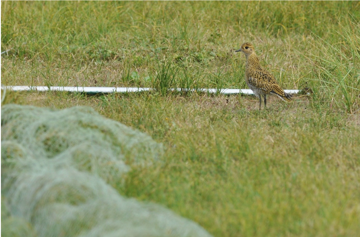
Afbeelding 11. Goudplevier, juveniel, pal achter het net van de slag, Meijendel, Wassenaar, 29 augustus 2013