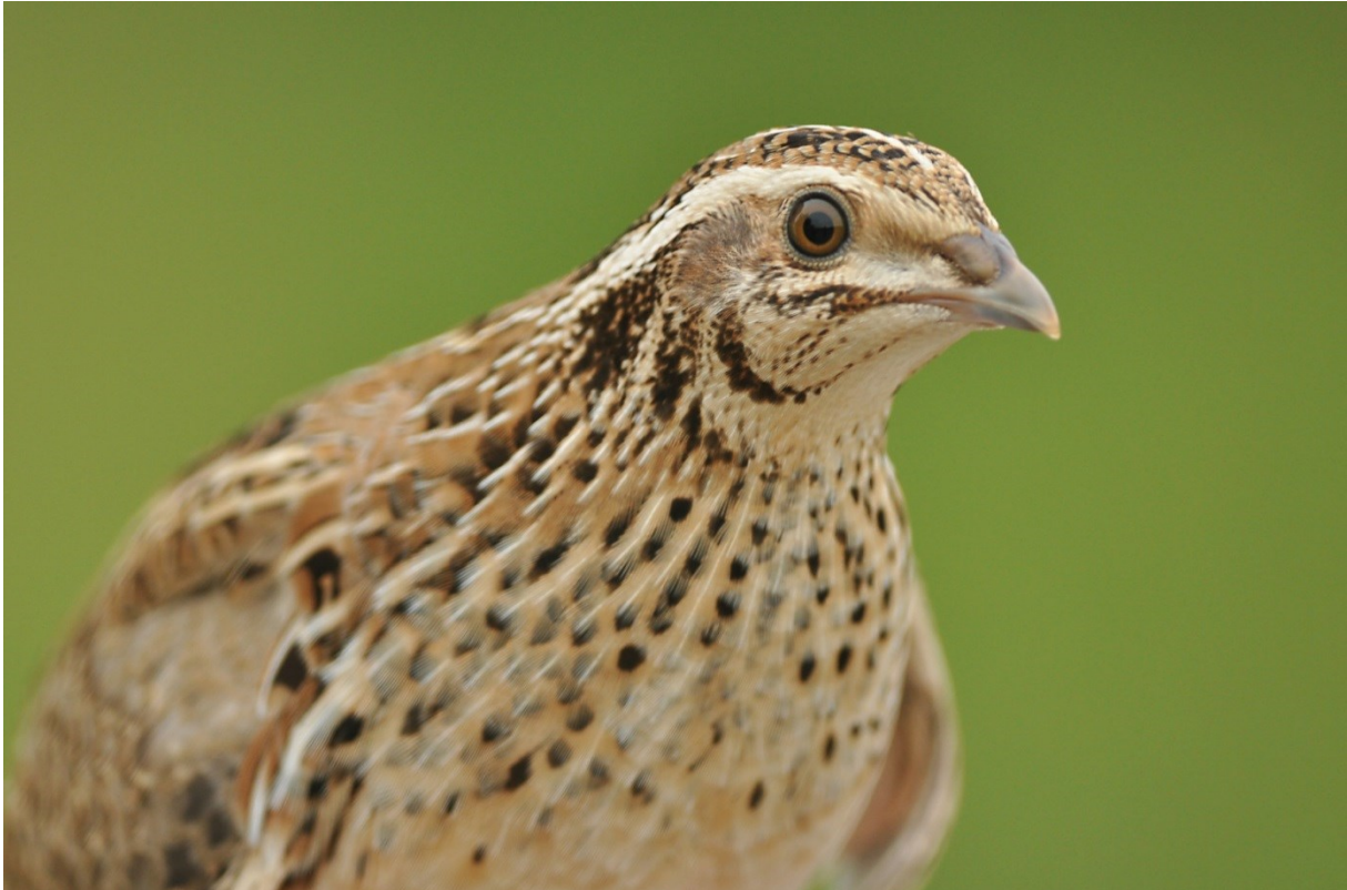
Afbeelding 10. Kwartel, eerstejaars vrouwtje, Meijendel, Wassenaar, 22 augustus 2013