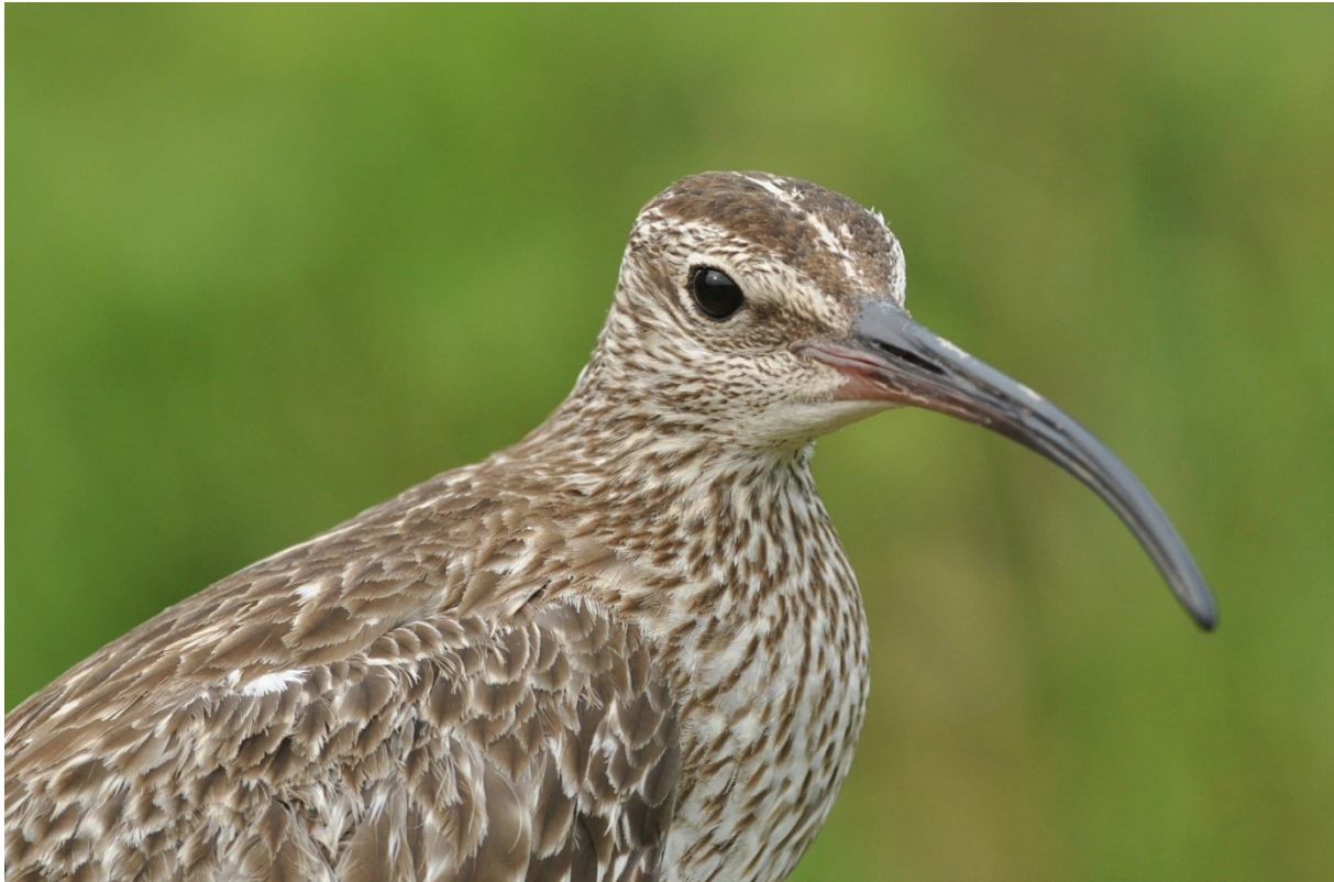
Afbeelding 4. Regenwulp, adult, Meijndel, Wassenaar, 7 augustus 2013: de eerste in de ringgeschiedenis van het gebied, die teruggaat tot 1927.

In totaal werden in Meijndel 4.589 exemplaren van 76 soorten geringd. Daarnaast waren er nog 388 terugvangsten. Daarmee was 2013 wat betreft het aantal vangsten tamelijk mager en wat betreft diversiteit redelijk. Het is dat we in januari dankzij sneeuwval nog een uitstekende start hadden (met 700 vangsten in 11 dagen tijd), anders was het jaartotaal ronduit bedroevend geweest. Het totaal aantal vangsten per soort in 2013, plus het gesommeerde aantal vangsten per soort voor de periode 2000-2012 is weergegeven in bijlage 1.