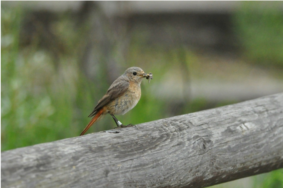
Afbeelding 7. Geringd vrouwtje Gekraagde Roodstaart met voer, Meijndel, Wassenaar, 29 juni 2013.

De Winterkoning was schaars in 2013. Deze soort is gevoelig voor strenge, sneeuwrijke winters en een verband met de omstandigheden in januari 2013 lijkt dan ook waarschijnlijk. Niettemin blijkt minimaal één in 2012 geringd jong deze periode te hebben overleefd (controle op 12 mei 2013).