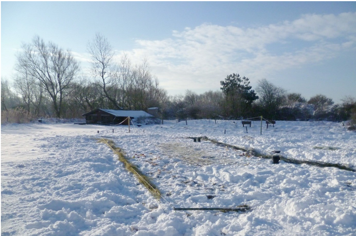
Afbeelding 3. De ringbaan in de sneeuw, Meijendel, Wassenaar, 16 januari 2013.

noordelijk, maar kreeg naarmate de zomer vorderde steeds vaker een oostelijke component. Al met al was het pas de eerste langdurige periode met behoorlijk stabiel weer in 2013. Tot begin september was het regelmatig uitstekend weer om te vangen. Pas daarna diende zich weer een lange storing aan, met een stevige westelijke stroming een heel veel regen: er kon nauwelijks geringd worden. Sterker nog, de najaarsmaanden september, oktober en november waren zelden zó nat: de herfst van 2013 haalde de top vijf van natste najaren in ruim een eeuw (bron: knmi.nl). In de laatste decade van september sloeg het weer om en was het tot in de eerste decade van oktober veelal zonnig, met oostenwind. Ideaal? Nou, het was oost 5 vaak zelfs 6 Bft, dus ongekend hard. Uiteindelijk ging oktober de boeken in als een zeer zachte maand, met heel veel regen (bron: weeronline.nl). Zowel op 4 als op 22 oktober werd het meer dan 20 °C! Daarnaast was er regelmatig storm. November was niet veel beter. Al met al waren droge dagen met weinig wind dit najaar zeldzaam.