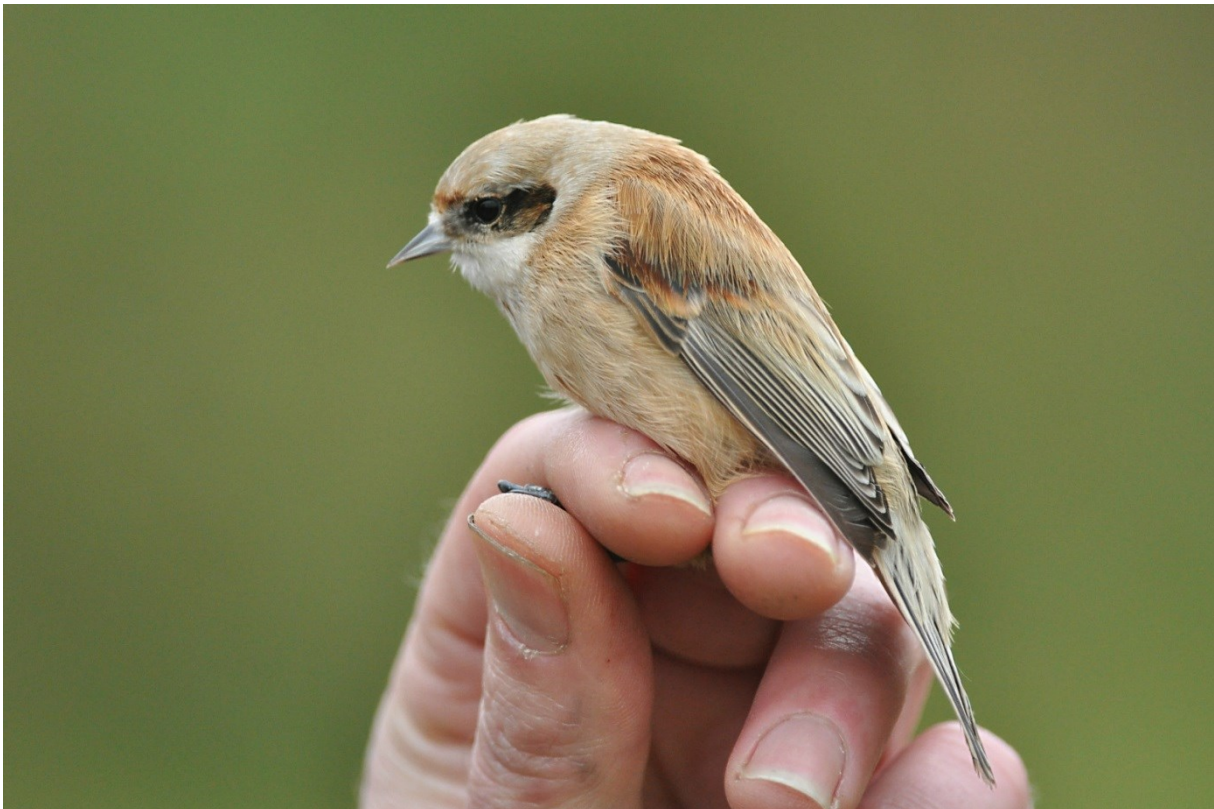
Afbeelding 20. Buidelmees, eerstejaars, Meijendel, Wassenaar, 2 november 2013

Voor het eerst sinds jaren zwierven er weer aardige aantallen Bardmannetjes langs de kust en dat resulteerde in zes vangsten. Minimaal één exemplaar bleef een tijdje hangen: een vogel van 19 oktober werd op 8 november teruggevangen. De laatste van het jaar werd op 7 december geringd tijdens de afsluitende klus- en opruimdag. De mezen deden het gemiddeld, zowel in de zomer als in het najaar, met in totaal 259 Pimpelmezen , 289 Koolmezen en zeven Glanskoppen . Boomkruiper was met 22 geringde vogels goed vertegenwoordigd. Op 23 september ving Erik Maassen in Kennemerland-Zuid een boomkruiper die wij op 2 augustus als jong hadden geringd. De afgelegde 35 km is de op vijf na verst teruggemelde Boomkruiper ooit in Nederland. Voor het eerst sinds 2009 werden weer twee Buidelmezen geringd: op 19 oktober en op 2 november. Op 7 juni werd tijdens een CES-ronde een Zwarte Kraai geslagen, pas de vierde sinds 2000. Omdat de vogel met het slagnet werd gevangen, valt deze niet onder het broedvogelonderzoek.