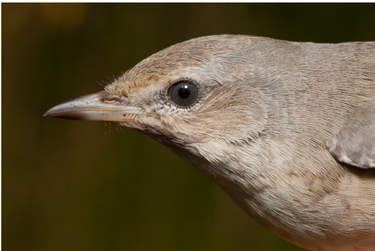
Afbeelding 19. Sperwergrasmus , eerstejaars, Meijndel, Wassenaar, 23 augustus 2013

onderzoek uitsluitsel geven over de determinatie. De vogel had minder wit op de binnenvlag van de buitenste staartpennen dan wij van deze (onder)soort verwacht hadden. Indien aanvaard betreft dit het vierde geval van blythi voor Nederland. Sperwergrasmussen waren landelijk schaars dit jaar. Er werd er bij ons dan ook maar één geringd, op 23 augustus. Tuinfluiter deed het met 125 exemplaren prima, met onder andere een vrij late op 19 oktober. Prima, dat kon niet gezegd worden van de Zwartkop , met 753 vangsten. Het was even geleden dat de duizend niet gepasseerd werd. Het slechte weer tijdens de trekpiek was hier zeker debet aan. Nog een grote afwezige was het Goudhaantje : die waren wel héél schaars. De eerste werd pas op 6 oktober bijgeschreven en met 17 vangsten beleefde de soort met afstand het slechtste jaar ooit. Vuurgoudhaantje kende een gemiddeld jaar, met 62 vangsten. Zowel in 2011 als 2012 ontbrak Bonte Vliegenvanger op de jaarlijst, terwijl ze tussen 2000 en 2010 jaarlijks vertegenwoordigd waren. Dit jaar werden ze gelukkig wel weer geringd en wel op 20 en 29 augustus en op 6 september.