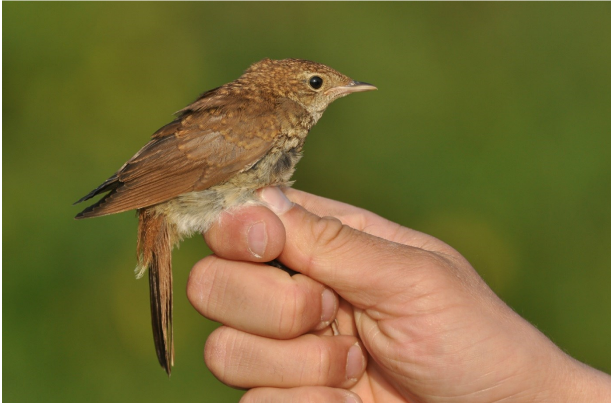
Afbeelding 9. Nachtegaal, juveniel, Meijendel, Wassenaar, 7 juli 2013.

Het totaal bedraagt 36 exemplaren en dit is, zeker in vergelijking met de aantallen tussen 2001 en 2008, bijzonder laag. Sinds het topjaar 2008 lopen de aantallen terug. Het aantal van 2013 was eenmaal nog lager, in 2010.