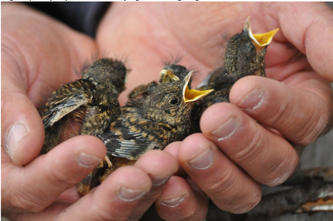
Afbeelding 8. Gekraagde Roodstaart, pulli, Meijndel, Wassenaar, 29 juni 2013.

Van de Gekraagde Roodstaart vond in 2013 een broedgeval plaats waarvan het nest gelokaliseerd werd. Bij dit nest namen we één geringde adulte vogel (het vrouwtje) waar. Van de acht eerstejaars vogels op de lijst zijn er vier als nestjong in dit nest geringd.