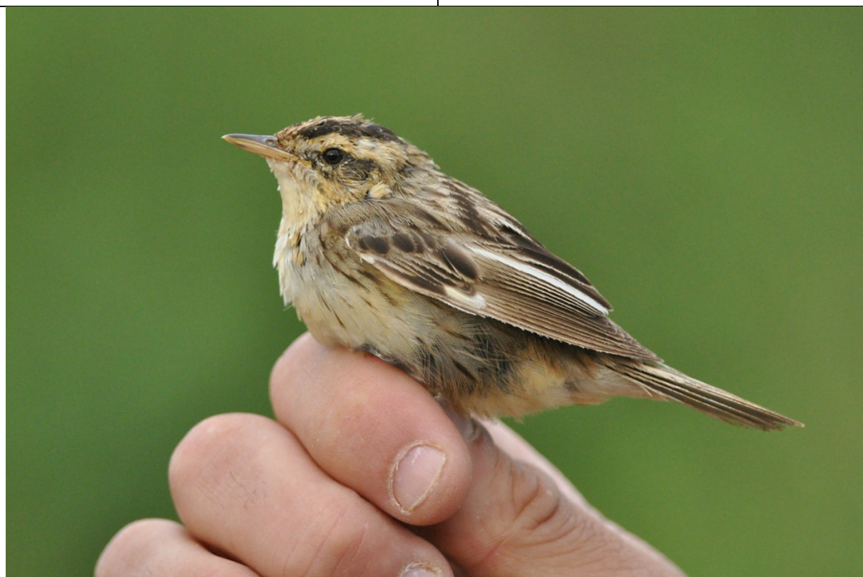
Afbeelding 15 –17. Waterrietzanger , adult, Meijndel, Wassenaar, 7 augustus 2013. Op de bovenste twee foto's is te zien dat de vogel enkele witte pennen in de vleugel heeft, maar dat het patroon niet symmetrisch is. Links is armpen 1 geheel wit, rechts armpen 4.