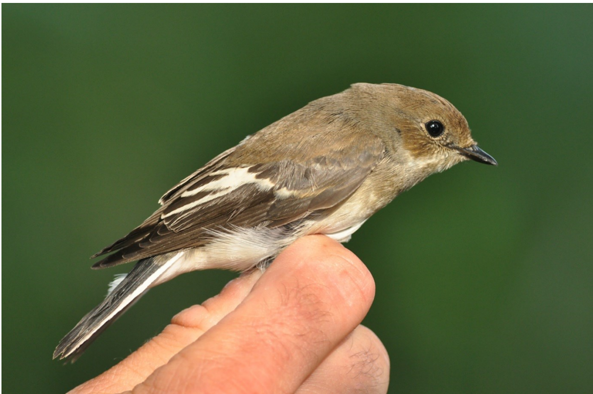
Afbeelding 18. Bonte Vliegenvanger, eerstejaars, Meijndel, Wassenaar, 29 augustus 2013

Sprinkhaanzanger deed het met 113 exemplaren prima, maar dat was zeker ook aan de vele vangdagen in augustus te danken: topdagen deden zich niet voor. Het was dit jaar lang wachten op een Snor , maar op 14 augustus kwam eindelijk de eerste binnen. Het was daarom verrassend dat zo laat in het seizoen, met daarna nog vangsten op de 20 e en de 27 e (twee), nog een jaarrecord werd gevestigd.