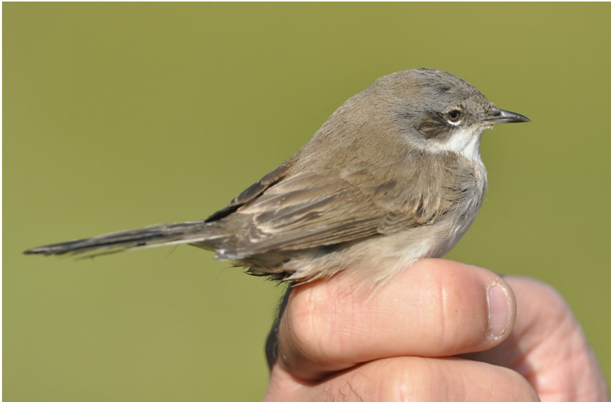
Afbeelding 21. Siberische Braamsluiper, eerstejaars, Meijndel, Wassenaar, 27 september 2013. Van deze vogel (AX42807) zijn twee borstveertjes verzameld. DNA-analyse toonde aan dat het een Siberische Braamsluiper betrof.

groeide door naar een pilot-onderzoek naar Tjiftjaffen op vijf ringplekken in Nederland. Naast Meijndel namen ook Vrs Van Lennep (Bloemendaal), Vrs Castricum, Vrg Grauwe Gans (Almere) en Vrs Schiermonnikoog hieraan deel. Sinds 2013 is het Vogeltrekstation te Heteren nauwer bij het onderzoek betrokken. Het soortenpalet is inmiddels uitgebreid. Er is een DEC-protocol (een protocol dat beoordeeld wordt door de Dierexperimentcommissie) opgesteld en na het volgen van een cursusavond kregen deelnemende ringers een artikel 16-ontheffing op de Wet op de Dierproeven, zodat borstveertjes actief verzameld kunnen worden – normaliter een handeling die zonder vergunning niet is toegestaan. Sinds 2013 worden naast Tjiftjaffen ook Fitis en Braamsluiper onderzocht. Daarnaast is er ruimte om materiaal van andere soorten te verzamelen.