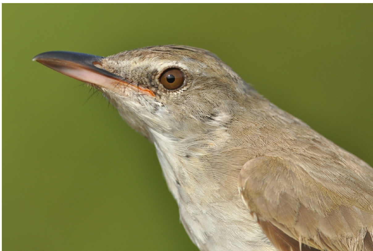
Afbeelding 14. Grote Karekiet, Meijendel, Wassenaar, adult, 23 juli 2013, 7 augustus 2013.

Het duurde even voordat de eerste Spotvogel werd gevangen, maar uiteindelijk werden op 20 en 25 augustus toch nog exemplaren geringd. Een Grote Karekiet , onze eerste adulte, werd op 23 juli gevangen, gevolgd door een eerstejaars op 7 augustus. Daarmee werden er voor het eerst meer dan één in een jaar geringd. Ondanks het beperkte aantal van zeven vangsten laten de ringdata van deze eeuw mooi de spreiding in de doortrektijd zien. Zie tabel 5.