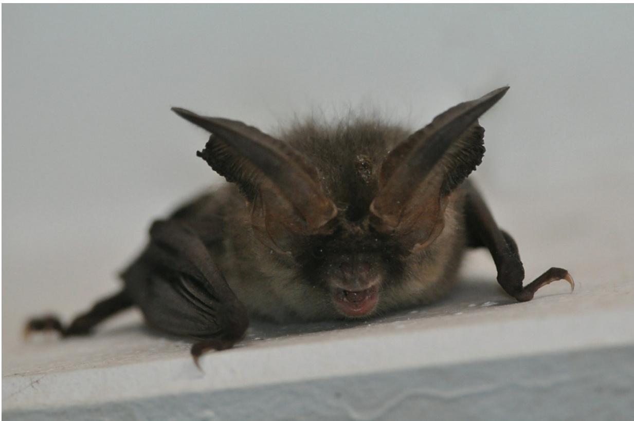
Afbeelding 25. Gewone Grootoorvleermuis, onvolwassen, Meijndel, Wassenaar, 29 augustus 2013

Op 29 augustus hing er midden in de nacht een eerstejaars Grootoorvleermuis in een mistnet. Het dier werd meegenomen naar de hut om het te controleren op een ring. Vleermuizen hanteren is andere koek dan vogels: het dier ontsnapte en ging in de hut hangen. Het donkere maskertje verradt dat het een jong dier is. Na wat foto's werd het beest weer gevangen en buiten losgelaten. Na Ruige Dwerg-, Dwerg- en Rosse Vleermuis is dit de vierde vleermuisensoort die hier gevangen is.