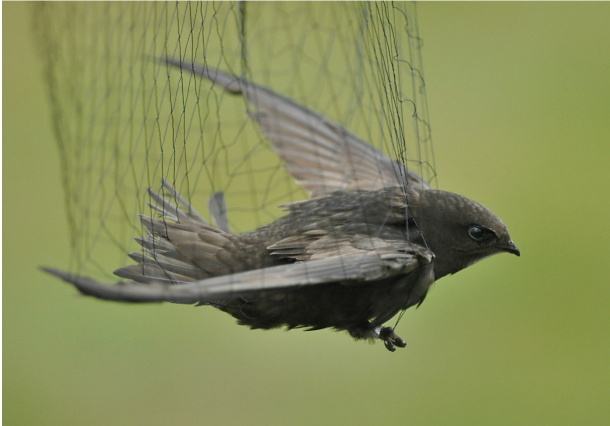
Afbeelding 23. Gierzwaluw, adult, Meijendel, Wassenaar, 22 januari 2013. Dit betreft een terugvangst van 5 juli 2011. Op 30 mei 2012 werd de vogel ook al gecontroleerd: vooralsnog is dit het enige individu dat ooit door ons terug werd gevangen.