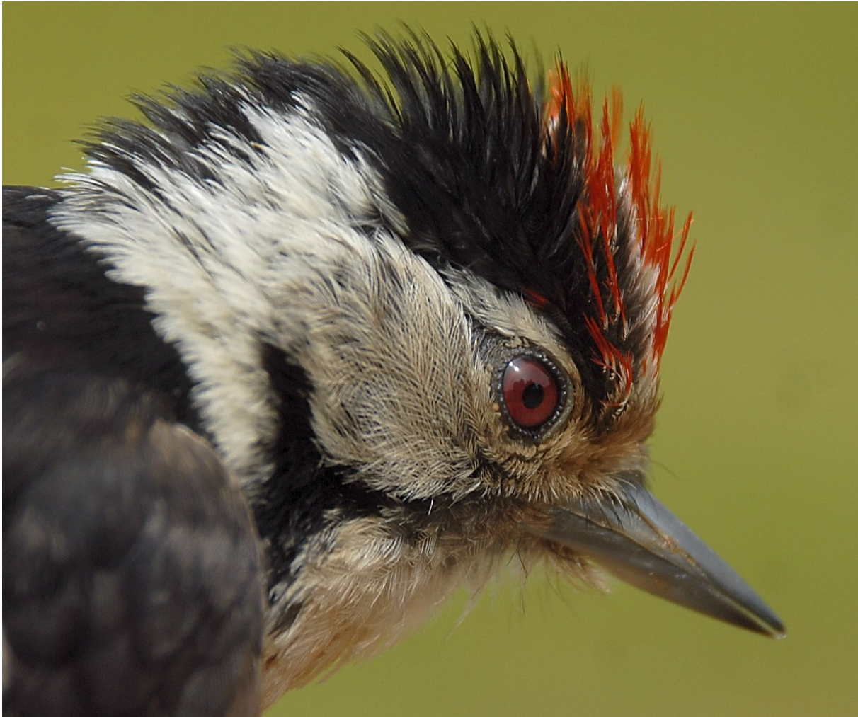
Afbeelding 13. Kleine Bonte Specht, adult mannetje, Meijndel, Wassenaar, 16 juli 2013

waargenomen, maar we merkten het ook aan de vangsten met exemplaren op 6, 16 (twee) en 23 juli. Het waren allemaal mannetjes, drie juveniele en een adulte vogel. Daarmee boekte de soort een jaarrecord (was drie in 2010). In de laatste decade van augustus was er een enorme influx van Draaihalzen in Nederland. Hoewel de aantallen van ringplekken in Noord-Holland (vooral Van Lennep, Bloemendaal) niet gehaald werden, beleefden we een uitstekend jaar. Tussen 20 en 27 augustus werden er vijf geringd. Tweemaal vingen we een eigen vogel terug: dat was in Meijndel nog niet eerder gebeurd.