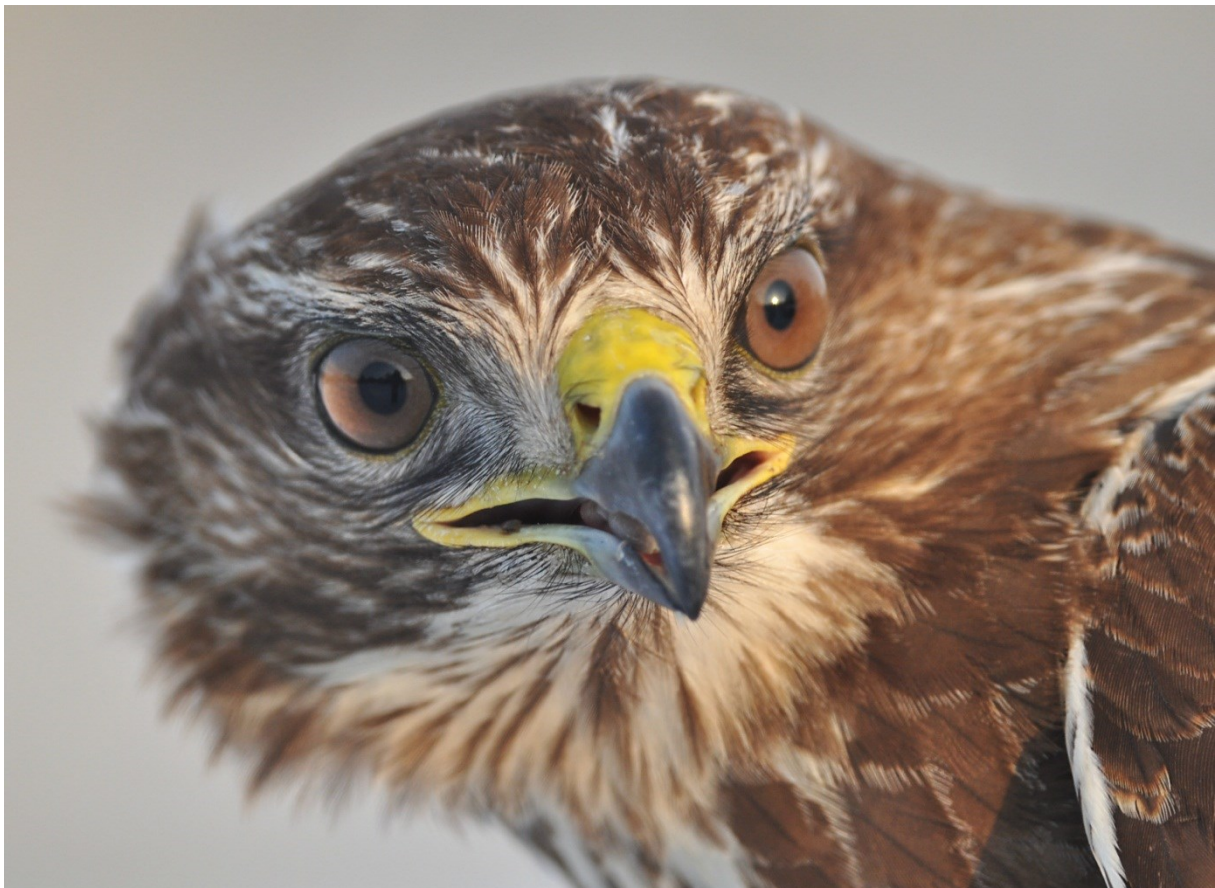
Afbeelding 1. Buizerd, tweede kalenderjaar, Meijndel, Wassenaar, 15 januari 2013

Net als in voorgaande jaren draaiden we diverse standaardonderzoeken. In januari kon voor de vierde winter op rij geringd worden met sneeuw. Vooral Kramsvogels deden het opvallend goed. In het voorjaar was er het reguliere broedvogelonderzoek CES. Gezien het extreem koude voorjaar viel dat nog niet eens niet tegen. Het resultaat van het nachtegalenonderzoek in de zomer was het slechtste ooit. In een aardige augustusmaand werd een nieuwe soort voor de ringbaan gevangen: een Regenwulp. Ook de reguliere najaarsvangst viel, mede vanwege het weer, tegen. Het genetische onderzoek naar taxa van Tjiftjaffen werd uitgebreid naar de soorten Braamsluiper en Fitis. Dat leverde een Siberische Braamsluiper op, niet alleen een nieuwe (onder)soort voor ons, maar ook voor de provincie Zuid-Holland. Tijdens de andere activiteiten van VRS Meijndel in Wassenaar, Den Haag, Noordwijk en Leiden werden nog eens 21 vogels van vijf soorten geringd: geen van deze soorten werd dit jaar eveneens in Meijndel gevangen. Vooral de Wespendif was bijzonder: niet eerder is hier een nestjong van in Zuid-Holland geringd.