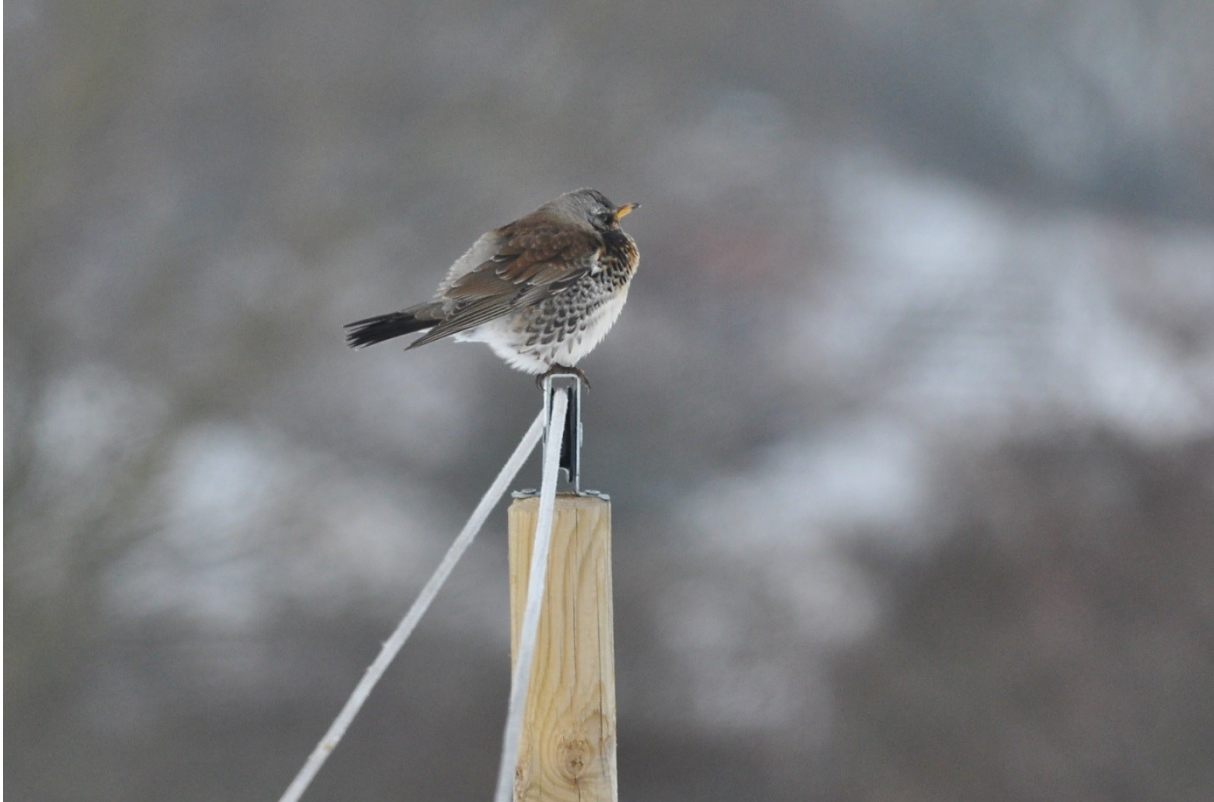
Afbeelding 24. Kramsvogel op het paaltje van de slag, gefotografeerd vanuit de hut, Meijndel, Wassenaar, februari 2013

Hieronder volgt een overzicht van losse waarnemingen van landelijk dan wel regionaal schaarse (of anderszins interessante) soorten op en in de directe omgeving van de ringbaan en de Duivenvoordse Polder.