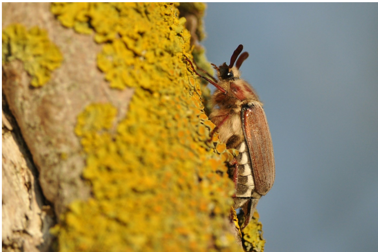
Afbeelding 26. Eén van de 82 Bosmeikevers, Meijendel, Wassenaar, 7 juni 2013.

Pauwoogpijlstaarten werden gezien op 7 juni en 14 juli en er waren Populierenpijlstaarten op 7 juni en 2 augustus. In juni en juli was Zuringspanner in ongewoon hoge aantallen aanwezig en Gewone Hagenheld was algemeen in de tweede helft van augustus. Op 7 juni werden liefst 82 Bosmeikevers uit de netten gepeuterd: zoveel waren er (bij lange na) niet eerder gezien. Julikevers werden alleen in – jawel – augustus gezien en wel op de 2 e (twee) en de 7 e . Bijzonder was dat op 1 en 16 oktober twee verschillende doodgravers werden gezien, resp. Nicrophorus investigator en Gewone Doodgraver . Op 12 september en 1 oktober zaten er twee Grote Glimwormen . Grote Groene Sabelsprinkhaan werd op 28 augustus en 22 september gezien.