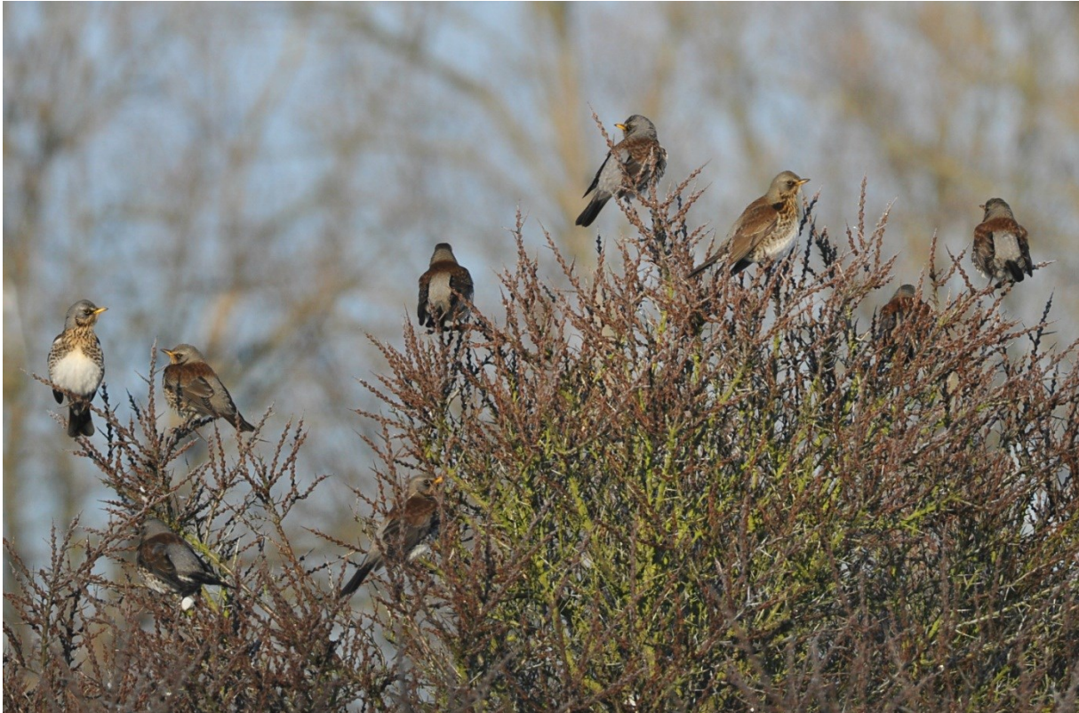
Afbeelding 5. Kramsvogels naast de ringhut tijdens spectaculaire sneeuwtrek, Meijndel, Wassenaar, 17 januari 2013. Een recordaantal van 665 exemplaren werd geringd.