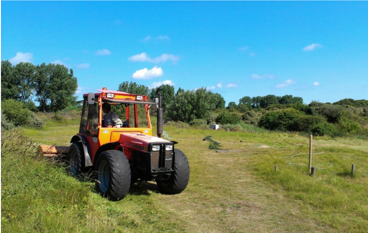
Afbeelding 2. René van Spronssen van Dunea maait het veld van onze ringlocatie, Meijndel, Wassenaar, augustus 2014.