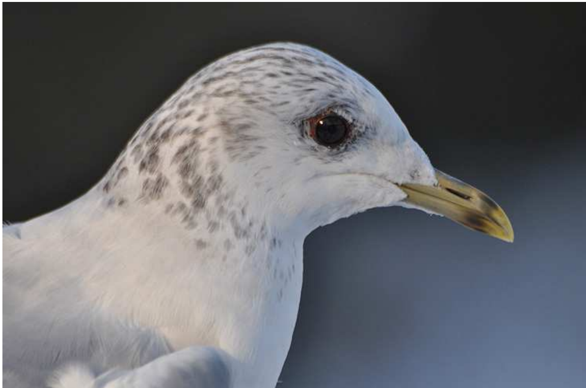
Afbeelding 4: Stormmeeuw, adult, Meijndel, Wassenaar, 19 december 2009. Eén van de nieuwe soorten in 2009. (© Vincent van der Spek). Rings: Kasper Hendriks, Vincent van der Spek en Wouter Teunissen.

Velduil, Grote Lijster, Kuifmees en Ortolaan waren (min of meer) toevalstreffers; de overige soorten zijn geringd tijdens gerichte vangpogingen.