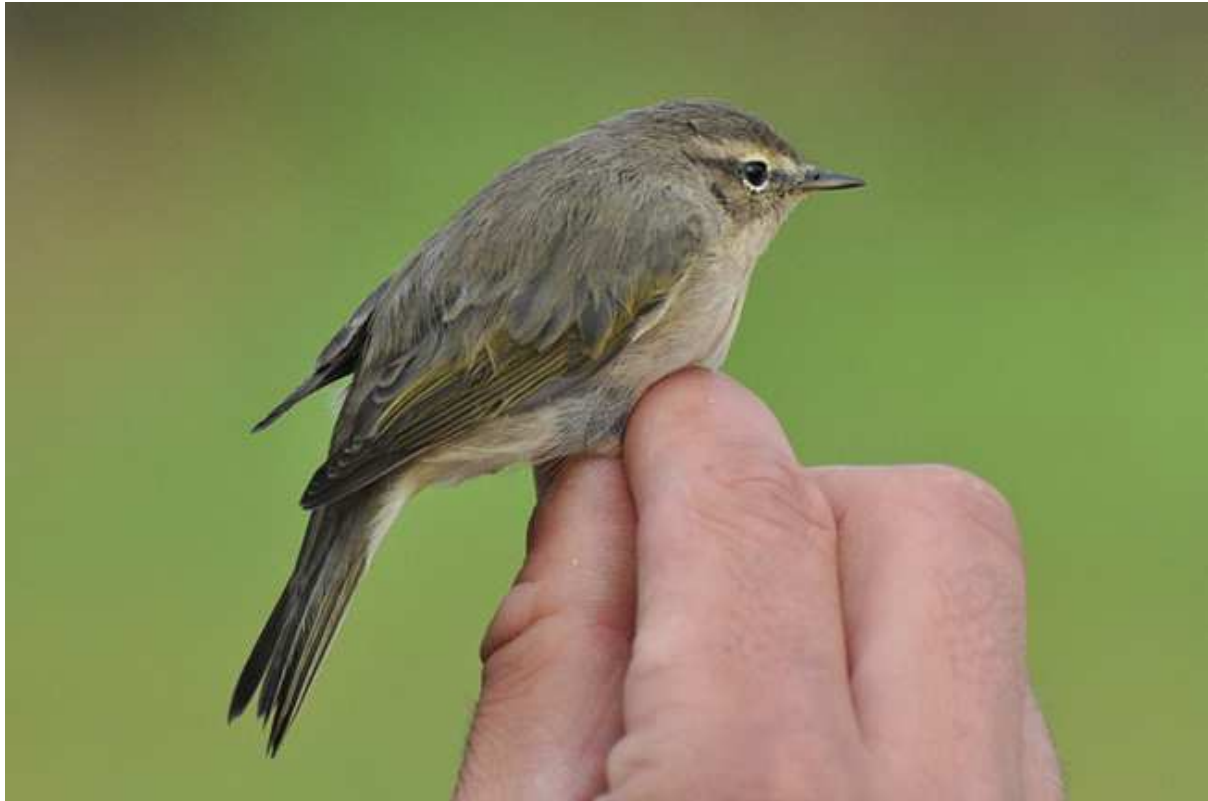
Afbeelding 19: Tjiftjaf met kenmerken van ssp. abietinus , Meijndel, Wassenaar, 26 september 2009. Ringers: Wijnand Bleumink, Laurens Buisman, Vincent van der Spek en Rinse van der Vliet.

In Nederland werden in het najaar van 2009 veel 'verdachte' Tjiftjaffen gemeld. Er waren diverse meldingen van Siberische Tjiftjaffen Phylloscopus collybita tristis , waarvan sommige exemplaren langer bleven hangen en door vele waarnemers werden geobserveerd. Door ringstations werden regelmatig Scandinavische Tjiftjaffen Ph. c. abietinus (11) en Siberische Tjiftjaffen (9) gemeld. De eerste gemelde 'verdachte' Tjiftjaf kwam uit Meijndel, op 26 september. Deze vogel vertoonde kenmerken van abietinus (zie foto). De snavelbasis en de snijrand zijn vleeskleurig en er zijn nog wat groene vlekjes zichtbaar op de rug van de vogel. Omdat de maten aan de kleine kant waren (ruim passend binnen collybita ) en het vroeg in het seizoen was, is de vogel 'voor de zekerheid' als Tjiftjaf – dus zonder specificatie van ondersoort – geringsd.