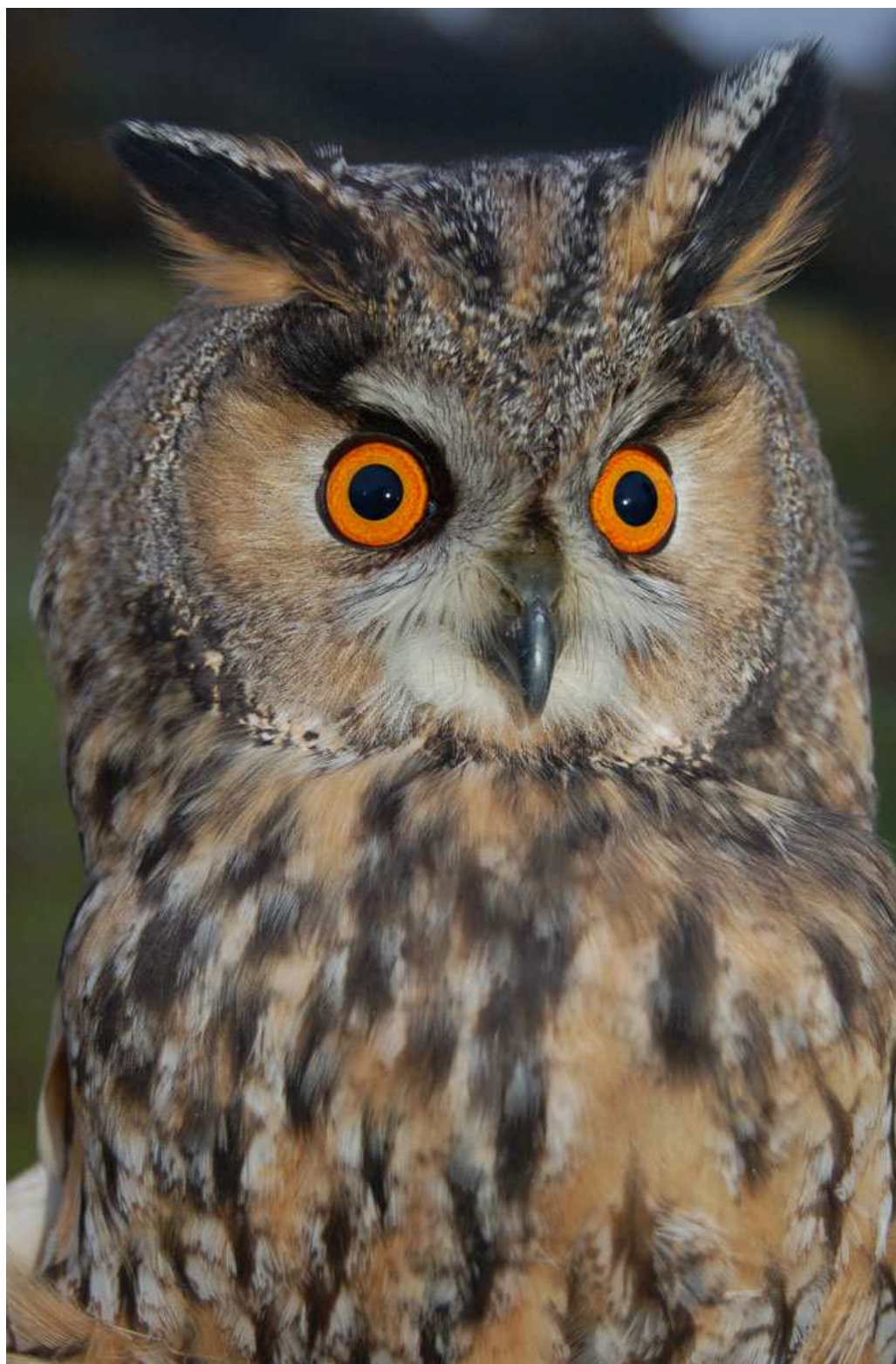
Afbeelding 25: Het vangen van uilen is een van onze specialiteiten. Ransuil, eerstejaars, Meijndel, Wassenaar, 7 november 2008. (© Vincent van der Spek). Ringers: Vincent van der Spek & Maarten Verrips.