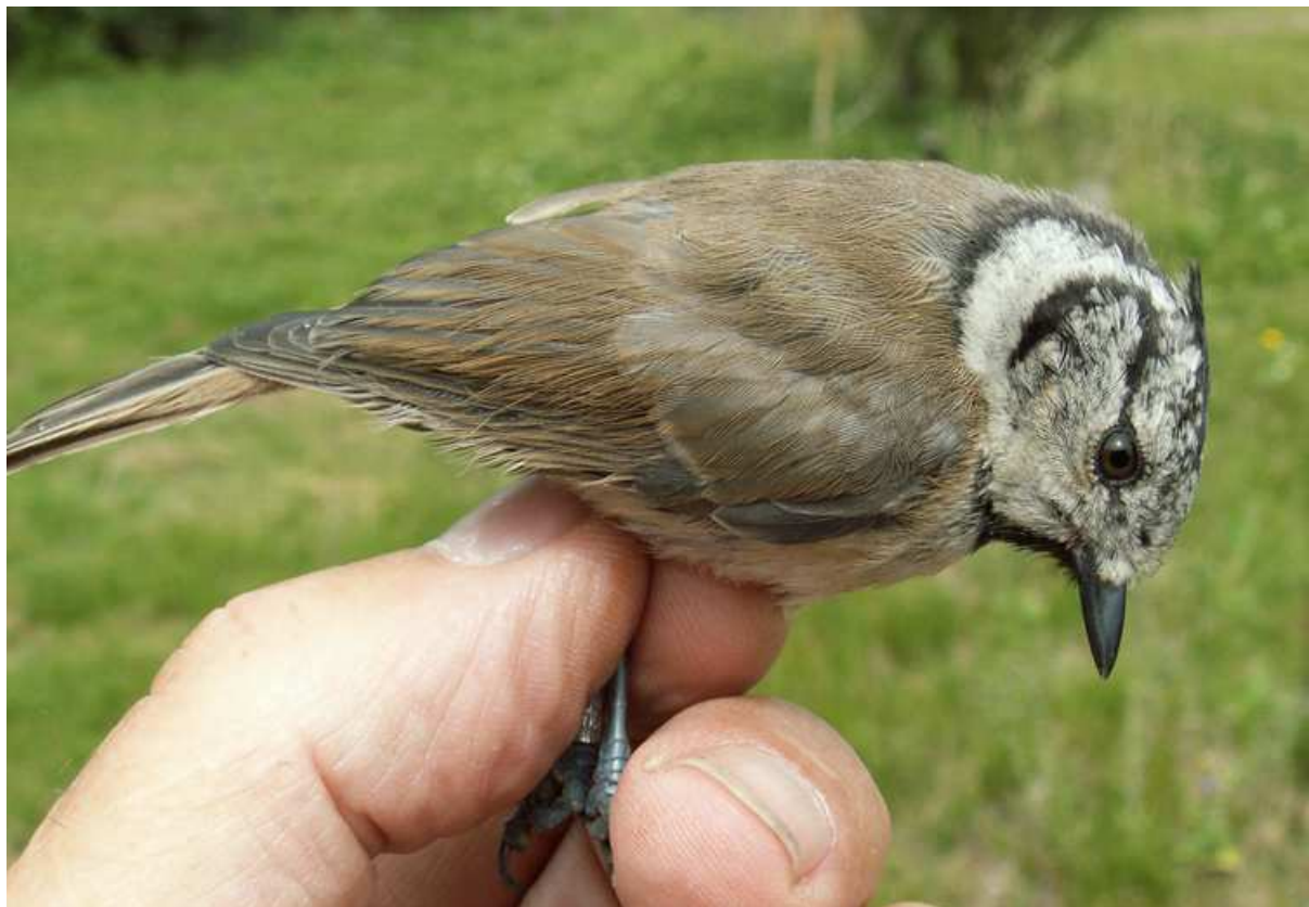
Afbeelding 5: Deze Kuifmees werd tijdens de CES gevangen. Het was een onverwachte nieuwe soort voor de ringbaan. Ze broeden op verschillende plekken in het duin, maar rondom de ringbaan is geen enkele naaldboom te bekennen. Meijendel, Wassenaar, 21 juli 2009. Ringers: Wijnand Bleumink, Maarten Verrips en Rinse van der Vliet

De resultaten in 2009 zijn weergegeven in tabel 2 (blz. 10), die is onderverdeeld in volwassen (N1) en eerstejaars (1K) vogels. De verhouding hiertussen geeft een indicatie van het broedsucces ter plaatse. In de tabel staat bij 'controles' het aantal in 2009 gecontroleerde volwassen vogels en het jaar waarin deze geringd zijn. Groen weergegeven getallen geven aan dat de betrokken vogel destijds als eerstejaars werd geringd.