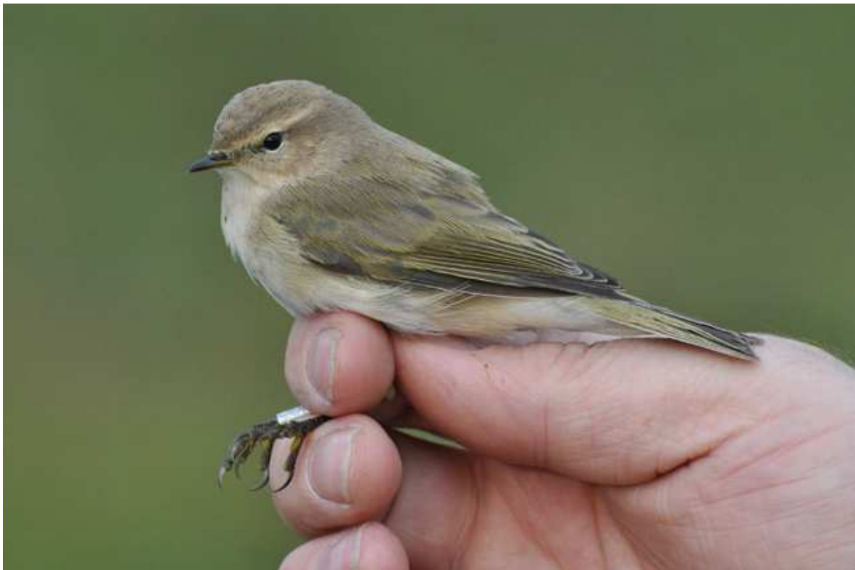
Afbeelding 21: Tjiftjaf van noordoostelijke herkomst abietinus/tristis. Meijendel, Wassenaar, 31 oktober 2009. Ringers: Vincent van der Spek en Wouter Teunissen.