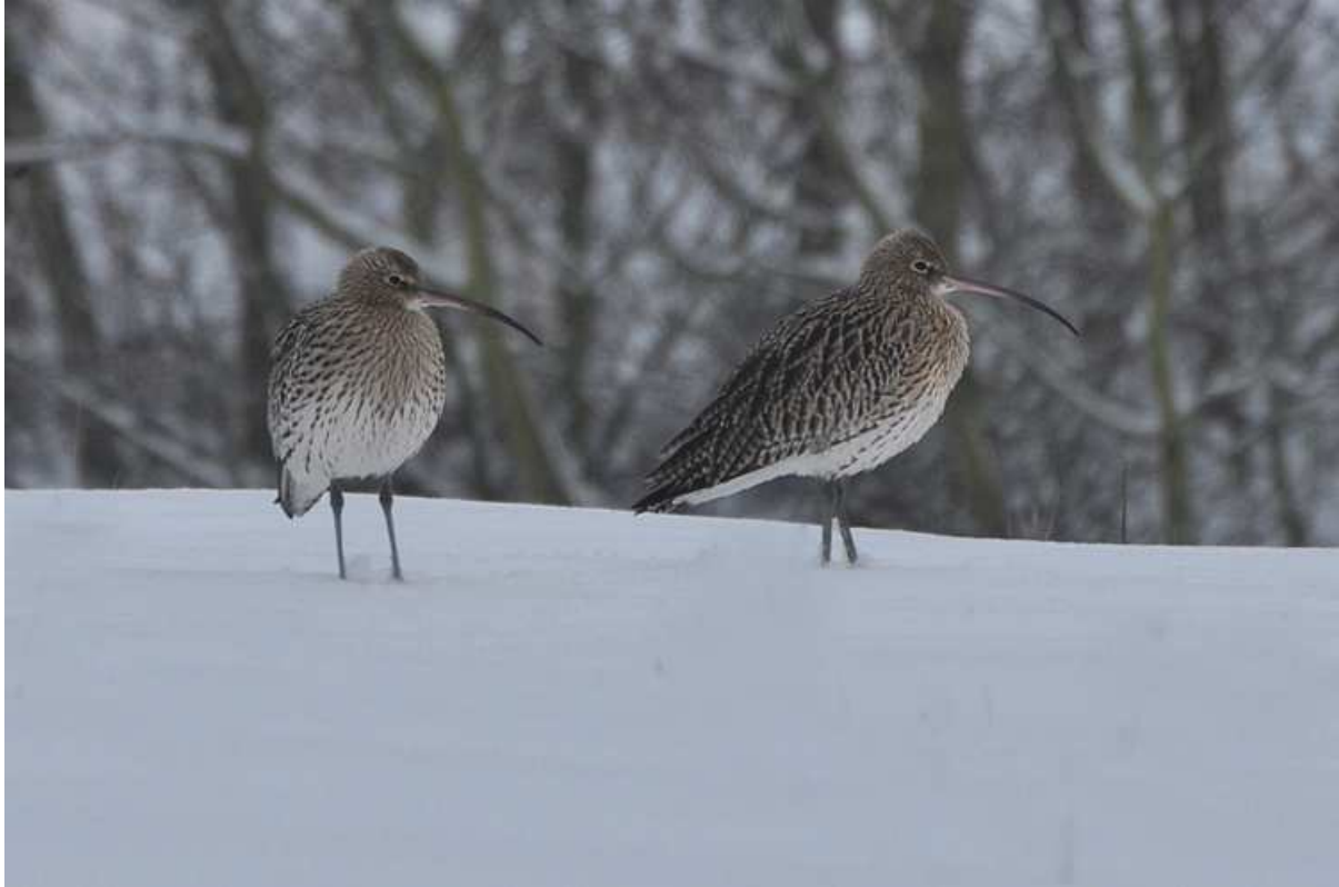
Afbeelding 17: Deze Wulpen landden bij de ringplek, maar werden door een jagende Havik verjaagd voordat ze konden worden gevangen. De vogels zijn gefotografeerd vanuit de ringershut. Meijndel, Wassenaar.

Er werden tijdens de sneeuwperiode nog 127 nieuwe vogels geringd, met onder andere Buizerd , Sperwer , Witgatje , Watersnip (11), Stormmeeuw , IJsvogel en Veldleeuwerik (81). Speciale vermelding verdient de Waterral die op de 24 e doodleuk de ringershut binnen kwam lopen. De vogel bleek broodmager: slechts 75 gram. De lichtste in het najaar wegen normaliter minstens 90 gram. Op de 31 e , een koude maar sneeuwvrije dag, werd een laatste poging gewaagd, die nog eens 15 nieuwe vangsten opleverde. De meest onverwachte uitsmijter van het jaar was een Grote Lijster – de tiende nieuwe soort voor de ringbaan dit jaar – die uit het niets doodleuk de slag op kwam lopen. De allerlaatste vogel die in 2009 werd geringd, was een Buizerd : de tweede van de maand én het jaar.