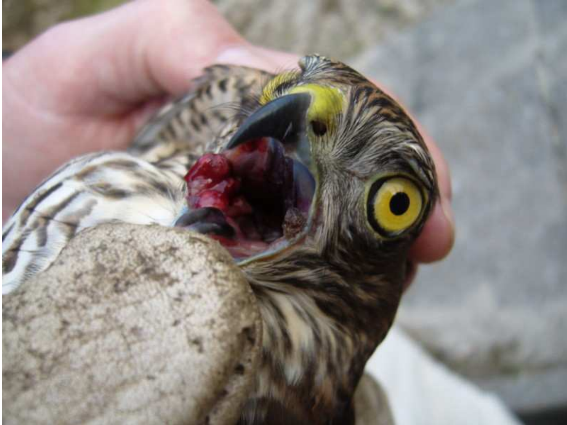
Afbeelding 7: Sperwer, eerstejaars mannetje, Meijendel, Wassenaar, 16 augustus 2009. De vogel heeft gezwollen in de mondhoeken, waarvan de rechter bloedt. Ringers: Cockie Boelen, Wouter Teunissen en Maarten Verrips

Twee experimenten eind augustus en in de eerste helft van september bleken geslaagd. De eerste was een poging om 's nachts Kwartelkoning te vangen. Bij poging één, in de nacht van 29 op 30 augustus, was het al bijna raak: een Kwartelkoning kwam tot vlak bij de netten, maar werd uiteindelijk niet gevangen. In totaal is tot eind september zes keer een poging gewaagd de soort te ringen. Op 11 september lukte het: een juveniele vogel – zelden afgebeeld in veldgidsen – hing in de netten: een nieuwe soort voor de ringbaan!