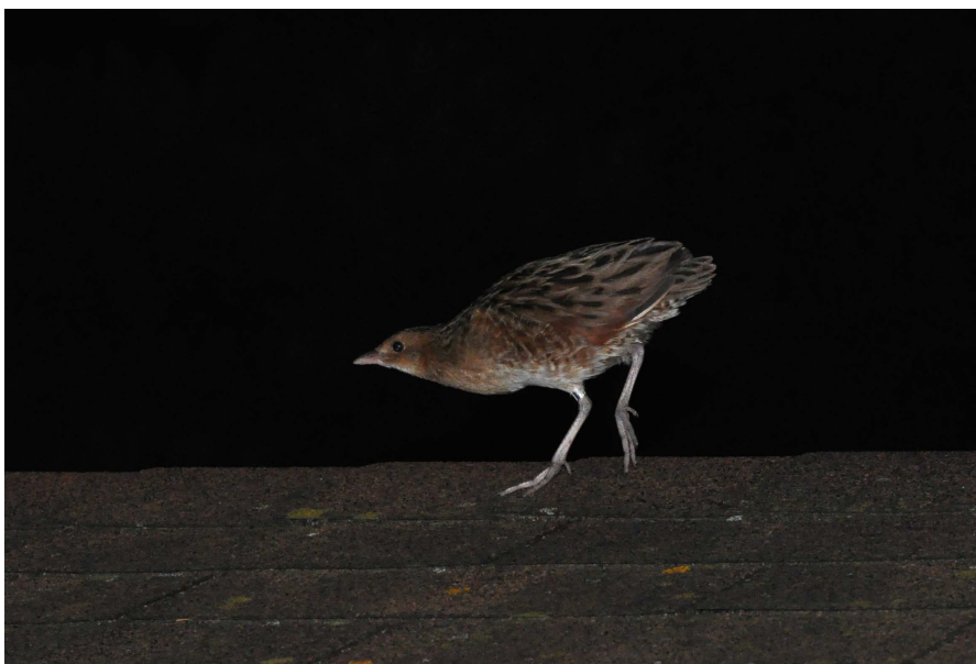
Afbeelding 8: Kwartelkoning, juveniel vlak na vrijlating, Meijendel, Wassenaar, 11 september 2009. Ringers: Wouter Teunissen en Vincent van der Spek

Twee experimenten eind augustus en in de eerste helft van september bleken geslaagd. De eerste was een poging om 's nachts Kwartelkoning te vangen. Bij poging één, in de nacht van 29 op 30 augustus, was het al bijna raak: een Kwartelkoning kwam tot vlak bij de netten, maar werd uiteindelijk niet gevangen. In totaal is tot eind september zes keer een poging gewaagd de soort te ringen. Op 11 september lukte het: een juveniele vogel – zelden afgebeeld in veldgidsen – hing in de netten: een nieuwe soort voor de ringbaan!