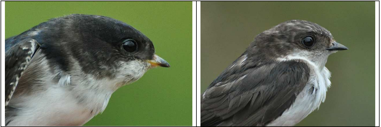
Afbeelding 9 & 10: Huiszwaluwen, eerstejaars, 13 september 2009: wederom een nieuwe soort voor de ringbaan. De vogels werden met stevige westenwind gevangen. Op de foto's is te zien hoe variabel de eerstejaars zijn. Twee exemplaren hadden luisvliegen: de in zwaluwen gespecialiseerde parasieten Stenoptheryx hirundinis. Ringers: Vincent van der Spek, Wouter Teunissen en Rinse van der Vliet.

Het tweede experiment was tijdens harde westenwind op 13 september, toen acht Huiszwaluwen werden geringd. Normaliter laat deze soort zich zeer lastig vangen, maar met storm lukt het ze niet altijd de netten te omzeilen. Een dag later werd nog een negende exemplaar geringd.