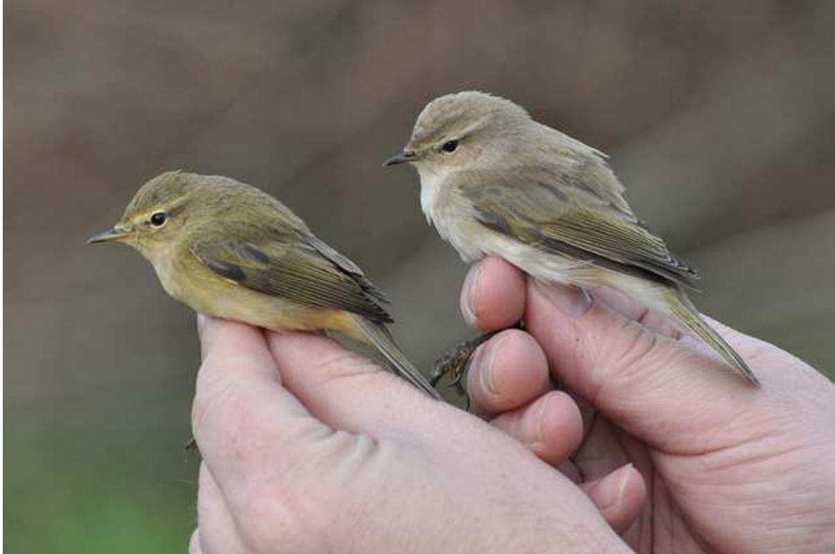
Afbeelding 20: De rechter Tjiftjaf abietinus/tristis is in ieder geval van noordoostelijke herkomst. Maar hoe noordoostelijk? De vogel toont duidelijk fors. Meijendel, Wassenaar, 31 oktober 2009. Ringers: Vincent van der Spek en Wouter Teunissen.