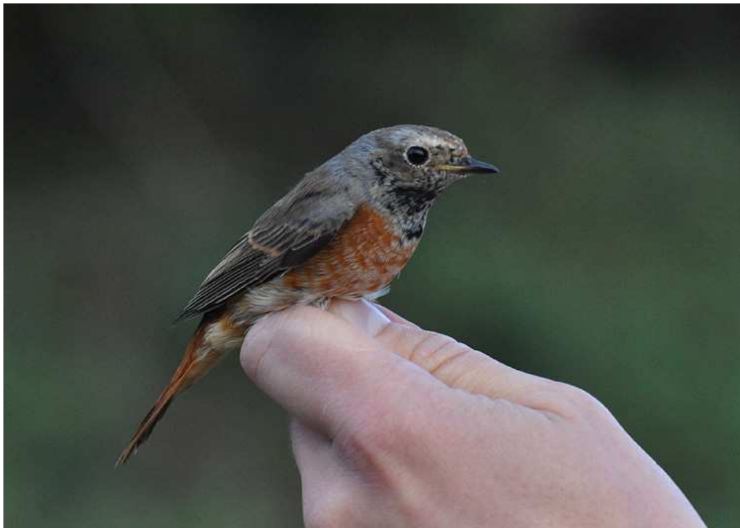
Afbeelding 11: Gekraagde Roodstaart, eerstejaars mannetje, 12 september 2009: in 2009 werd een recordaantal roodstaarten geringd. Ringers: Kasper Hendriks, Vincent van der Spek en Wouter Teunissen.

Opvallend was de aanwezigheid van Gekraagde Roodstaarten dit jaar, met 21 vangsten. Het oude jaarrecord (8 ex. in 2004) werd verpulverd. Ook andere ringbanen in het land vingen meer Gekraagde Roodstaarten dan anders, maar in Meijndel werd ook ander geluid gebruikt. Wellicht was er sprake van een "dubbel effect". Driemaal werden drie exemplaren op een dag geringd.