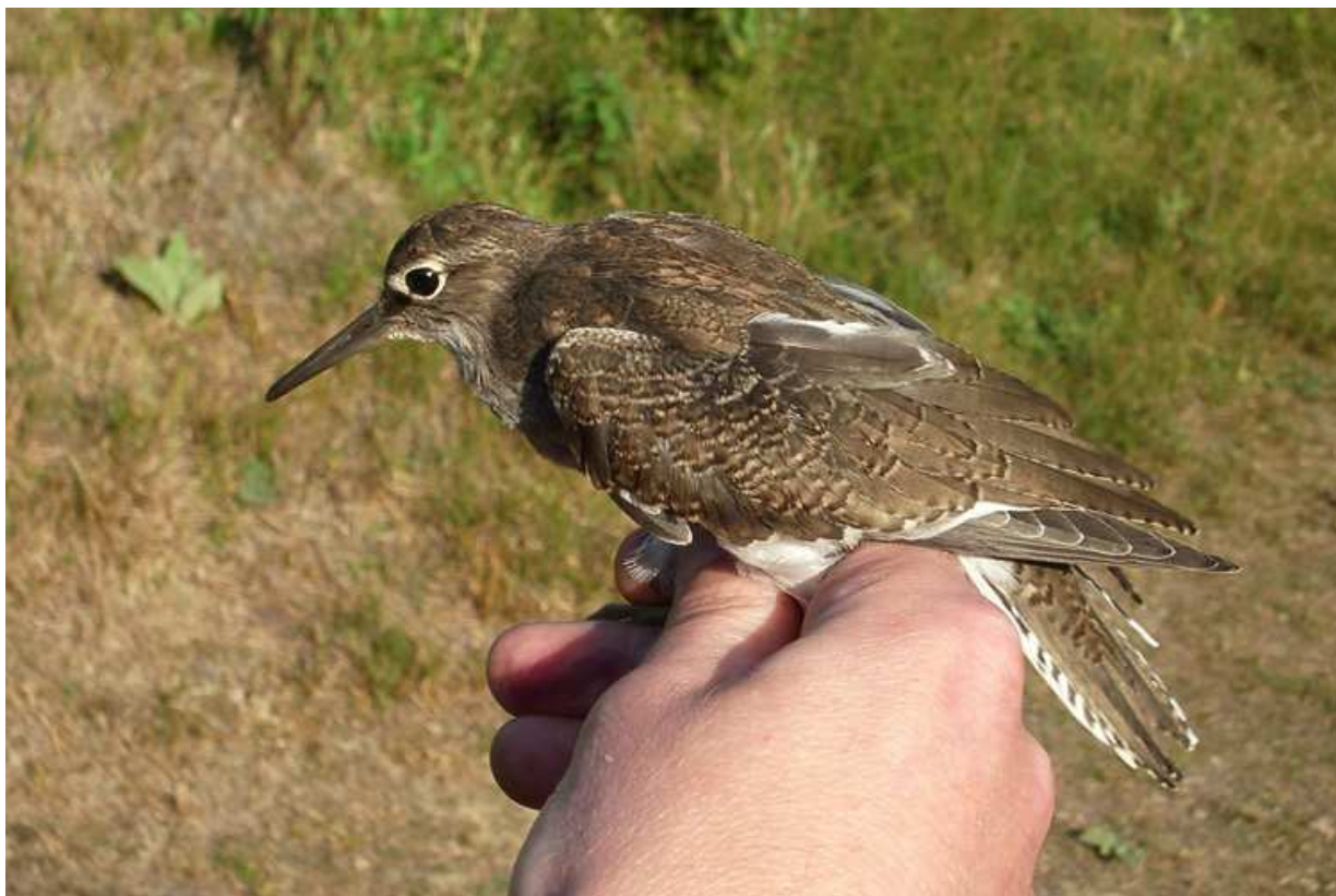
Afbeelding 23: Sinds 2008 wordt zo nu en dan gericht gepoogd steltlopers te vangen. Zowel in 2008 als in 2009 werd daarbij een Oeverloper geringd. Dit is een eerstejaars, Meijendel, Wassenaar, 23 augustus 2009. Ringers: Kasper Hendriks, Wouter Teunissen, Maarten Verrips en Rinse van der Vliet

In tien jaar tijd zijn de vangers steeds wijzer geworden. Diverse experimenten hebben ertoe geleid dat soorten die aanvankelijk niet of nauwelijks geringd werden, nu (vrijwel)