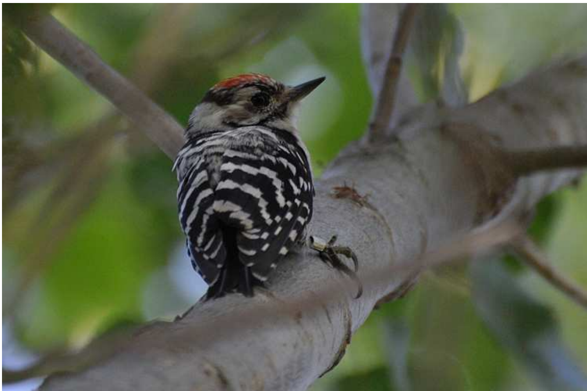
Afbeelding 6: Kleine Bonte Specht, eerstejaars mannetje na vrijlating, 4 augustus 2009, Meijndel, Wassenaar. Ringers: Wijnand Bleumink, Vincent van der Spek en Rinse van der Vliet.

De gecontroleerde Zwartkop was een mannetje dat we hebben geringd op 25 september 2008. Dit is volop in de trektijd en kan erop wijzen de vogel niet in de buurt is grootgebracht. De gecontroleerde Rietgors droeg een Franse ring.