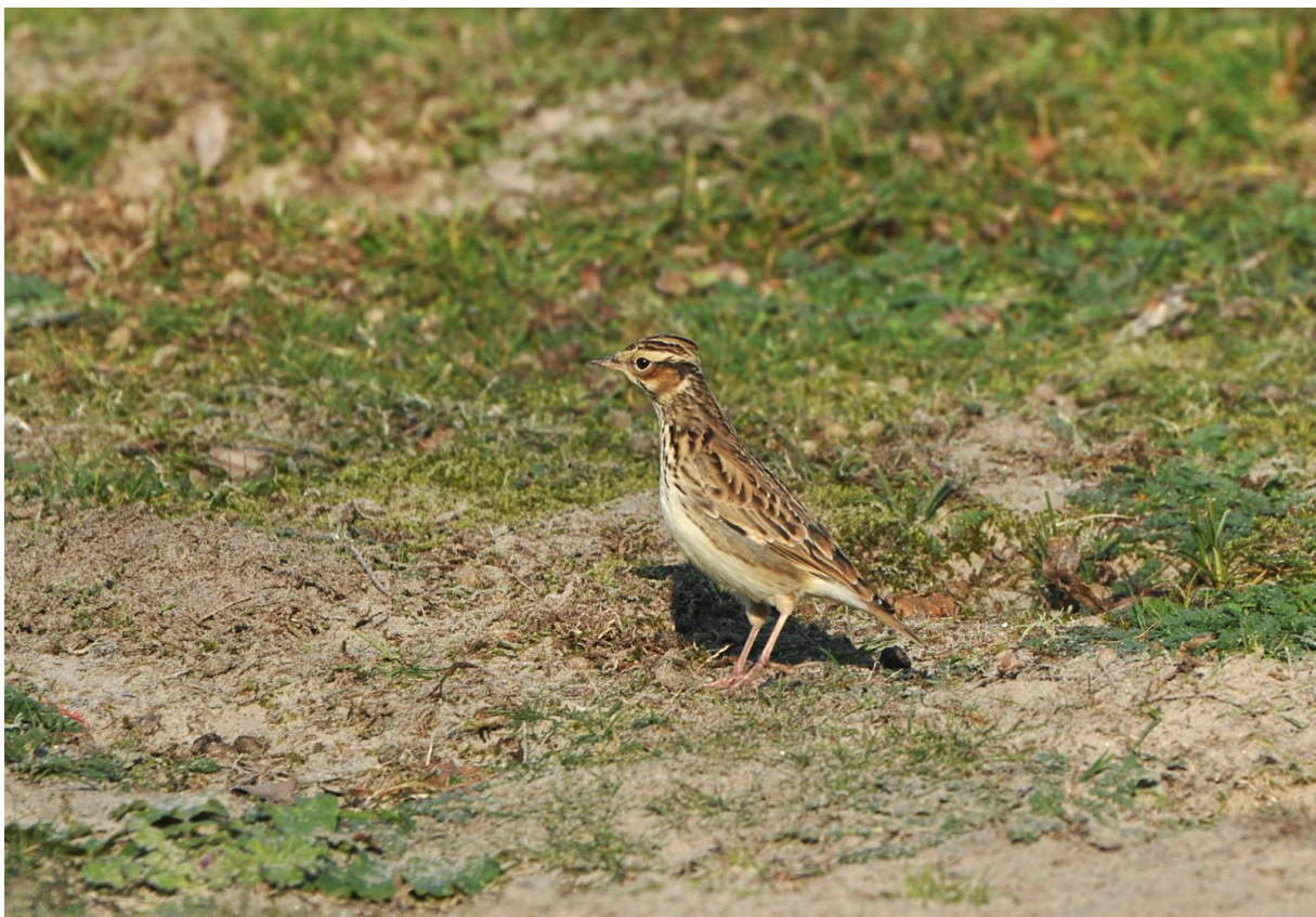
Afbeelding 22. Boomleeuwerik , Meijndel, Wassenaar, 23 oktober 2011. Deze vogel landde niet op de slag, maar drie meter voor de ringhut. De vogel is door het slagnetluik gefotografeerd. In 2011 werden er 30 geringd: een recordaantal).

De Boomleeuwerik is een van de weinige echte specialiteiten van de ringbaan in Meijndel. De eerste werd op 14 oktober met het slagnet verschalkt, de laatste op 13 november. Het jaartotaal bedroeg een recordaantal van 39 (was 26, in 2009), met een mooi dagrecord van 17 op 22 oktober (was 13).