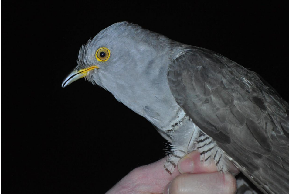
Afbeelding 5. Koekoek, adult mannetje, Meijndel, Wassenaar, 2 juni 2011. Deze Koekoek vloog in de avondschemer roepend de voor Kwartels opgestelde netten in: een onverwachte bijvangst

In de nachten van 20-21 mei en 1-2 juni werd voor het eerst gepoogd Kwartels te vangen. En met succes: tijdens de eerste poging hingen er twee exemplaren in de netten, tijdens de tweede poging vier: de eerste Kwartels in de ruim 80 jarige geschiedenis van het ringwerk in Meijndel. Ook vloog tijdens die laatste sessie in de avondschemer – de boel was nét opgezet - een roepend mannetje Koekoek de netten in: ook al een nieuwe soort voor de ringbaan. In augustus zou er nog een juveniel uit een mistnet ontsnappen.