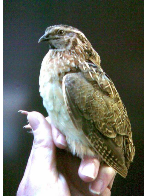
Afbeelding 4: Kwartel, mannetje, Meijndel, Wassenaar, 21 mei 2011. De eerste nieuwe soort in 2011.

Tevens zijn, gerekend vanaf de herstart van het VRS in 2000, drie nieuwe soorten gevangen. In chronologische volgorde zijn dat: Kwartel (twee op 21 mei en vier op 2 juni), Koekoek (2 juni) en Bosuil (18 augustus). Daarvan was Kwartel überhaupt nog nooit in Meijndel geringd, dus ook niet in de 20 e eeuw (voor de herstart).