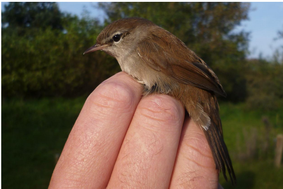
Afbeelding 18: Cetti's Zanger, adult vrouwtje, Meijendel, Wassenaar, 25 september 2011

De trek van Zwartkoppen begon al vroeg, met in de maand augustus al 213 vangsten. Op de 26 e van deze maand werden 72 exemplaren gevangen, waaronder een vogel met een Nederlandse ring. Ook in september bleken ze algemeen, met in totaal 958 nieuw geringde vogels. Vooral de 16 e was goed: 157 vangsten betekende de tweede dag ooit. Wie weet waar de teller was geëindigd als het in de eerste drie weken van september niet zo vaak gestormd had? Uiteindelijk bleek 2011 het op één na beste jaar ooit voor de soort, met een jaartotaal van 1.434. De 'jaarlijkse' Sperwergrasmus hing op 23 augustus in de netten. Zonder uitgesproken topdagen deed ook de Tuinfluiter het behoorlijk, met een jaartotaal van 131 nieuwe vangsten. Op 10 september werd een vogel met Belgische ring gevangen. De zesde Cetti's Zanger sinds 2000 werd op 25 september geringd.