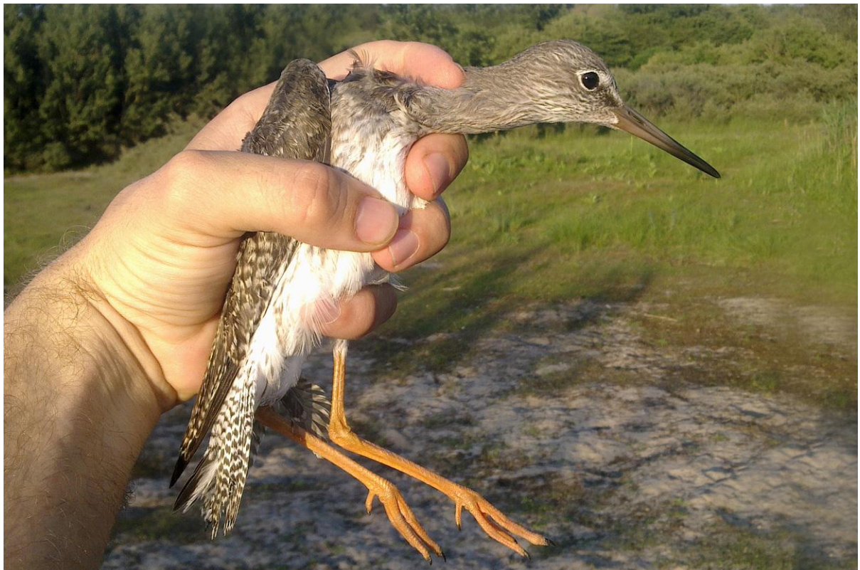
Afbeelding 10: Tureluur , juveniel, Meijendel, Wassenaar, 10 juli 2011