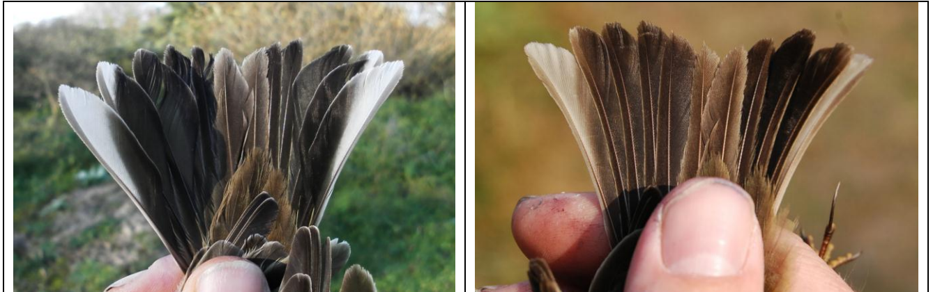
Afbeelding 20 en afbeelding 21. Links de staart van Waterpieper, 23 oktober 2011 en rechts: staart van Oeverpieper, oktober 2008, Meijndel, Wassenaar. Bij Waterpieper zijn de staartzijden wit, bij Oeverpieper grijsig. Daarnaast heeft de vijfde staartpen (van binnen naar buiten geteld) bij Waterpieper een kenmerkende, diagnostische witte inkeping.

schaarser geacht wordt. Niet alle beesten zagen er even klassiek uit, maar onder andere de staart gaf de doorslag (zie afbeelding 20 en 21). Tijdens één van de pogingen om Waterpiepers te vangen, kon ook de eerste Klapekster sinds 2008 worden geslagen.