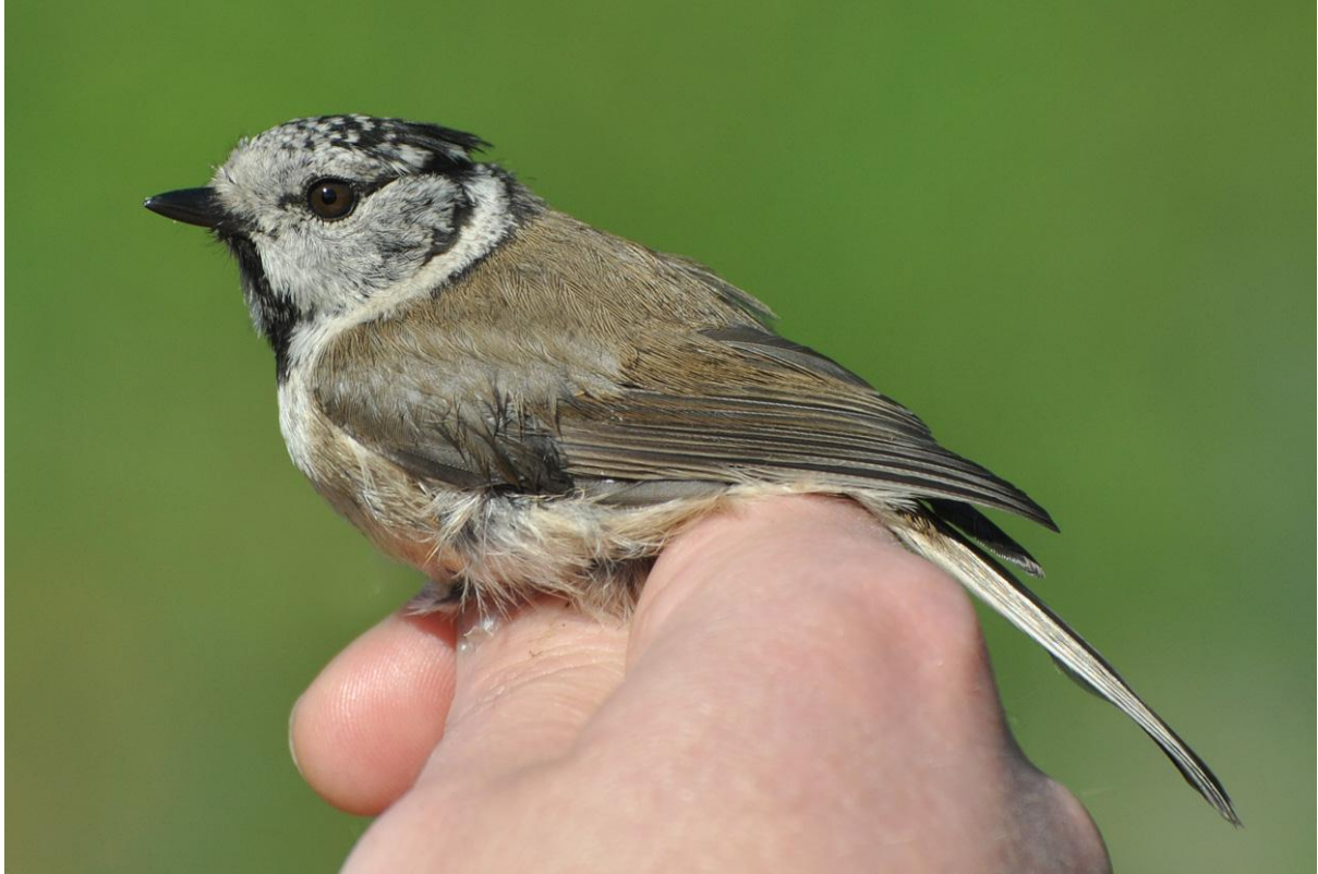
Afbeelding 9: Kuifmees , Meijendel, Wassenaar, 5 juli 2011