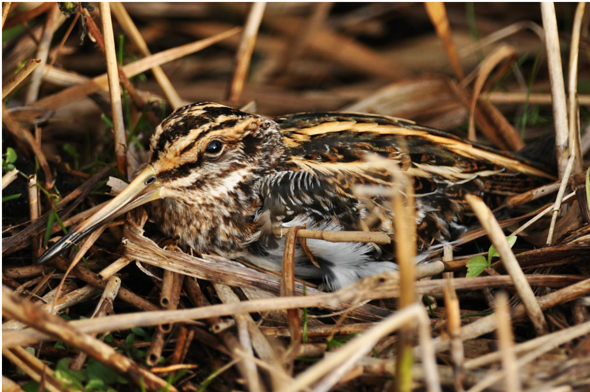
Afbeelding 26. Bokje, Duivenvoordse Polder, 31 december 2011.