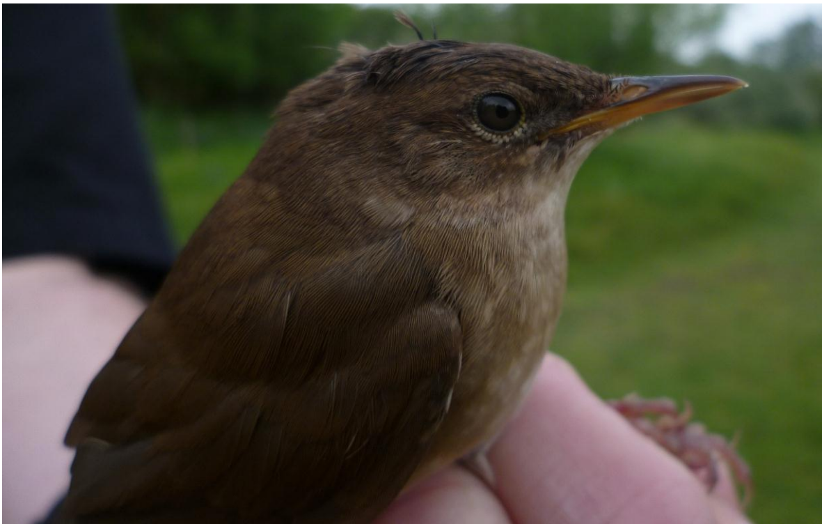
Afbeelding 12: Snor, eerstejaars, Meijndel, Wassenaar, 21 juli 2011

Het was voor deze ringplek een goed jaar voor Spotvogels , met vangsten op 2 (adult), 6 (twee eerstejaars) en 23 augustus (eerstejaars).