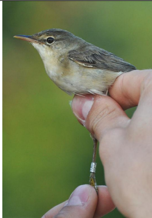
Afbeelding 10 Kleine Karekiet, adult met Zweedse ring, Meijndel, Wassenaar, 2 augustus 2011.

In de tweede helft van juli en de eerste dagen van augustus werden opvallend veel volwassen exemplaren geringd, zowel absoluut als in verhouding tot het aantal jongen. Op sommige dagen waren adulte vogels zelfs in de meerderheid. Vermoed werd dat veel vogels in West-Afrika een goed winterseizoen achter de rug hadden, maar dat de reproductie in onze contreien slecht was. Veel jonge Kleine Karekieten vertoonden ook groeistrepen: markeringen in het verenkleed die ontstaan als een vogel de groei van de vleugel- en/of staartveren tijdelijk onderbreekt door een tekort aan voedsel. Meestal zijn deze strepen in de staart te zien, maar soms ook in de vleugel (zie afbeelding 11).