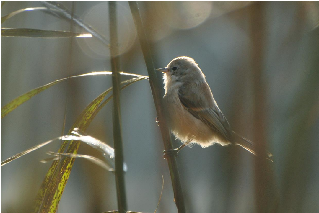
Afbeelding 28. Buidelmee , juveniel, Meijendel, Wassenaar, 26 augustus 2011. De vogel, onderdeel van een groepje van vier, zat net achter een van de netten, maar kon niet worden gevangen.

Hieronder volgt een overzicht van losse waarnemingen van landelijk dan wel regionaal schaarse (of anderzijds interessante) soorten op en in de directe omgeving van de ringbaan.