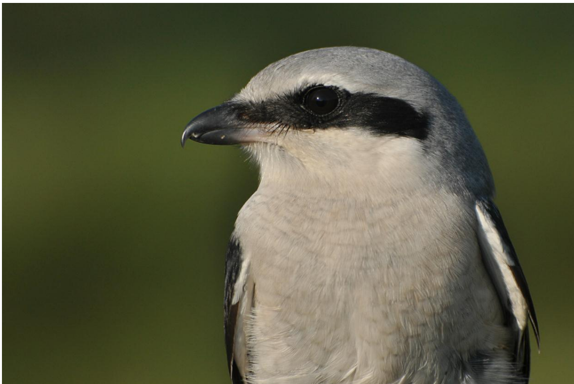
Afbeelding 2: Klapekster, eerstejaars. Meijndel, Wassenaar, 24 oktober 2011

Ook is er aandacht voor losse waarnemingen op en rondom de ringbaan. Hierna volgt de lijst met terugmeldingen die het afgelopen jaar werden ontvangen, evenals de totaalijst van de nieuw geringde vogels.