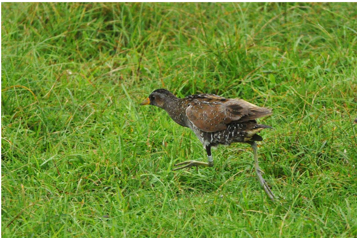
Afbeelding 23. Porseleinhoen, adult na het loslaten, Meijndel, Wassenaar, 26 augustus 2011.

In Meijndel worden regelmatig uilen gevangen, maar de enige soort die tijdens vrijwel iedere nachtvangst gehoord wordt, weet de netten normaal gesproken uitstekend te vermijden. Daar kwam op 18 augustus verandering in, toen voor het eerst dit millennium een Bosuil werd geringd. De eerste Kerkuil in twee jaar, in de nacht van 22 op 23 oktober, bleek al geringd. De vogel was in juni als nestjong van aluminium voorzien in Valkenburg, ZH. Voor het tweede jaar op rij werd niet één Ransuil gevangen.