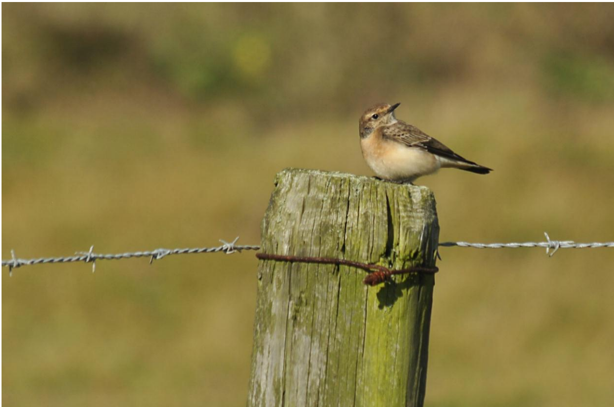
Afbeelding 29. Bonte Tapuit, eerstejaars, Meijendel, Wassenaar, 31 oktober 2011.

Eén exemplaar vloog naar noordoost op 9 januari.