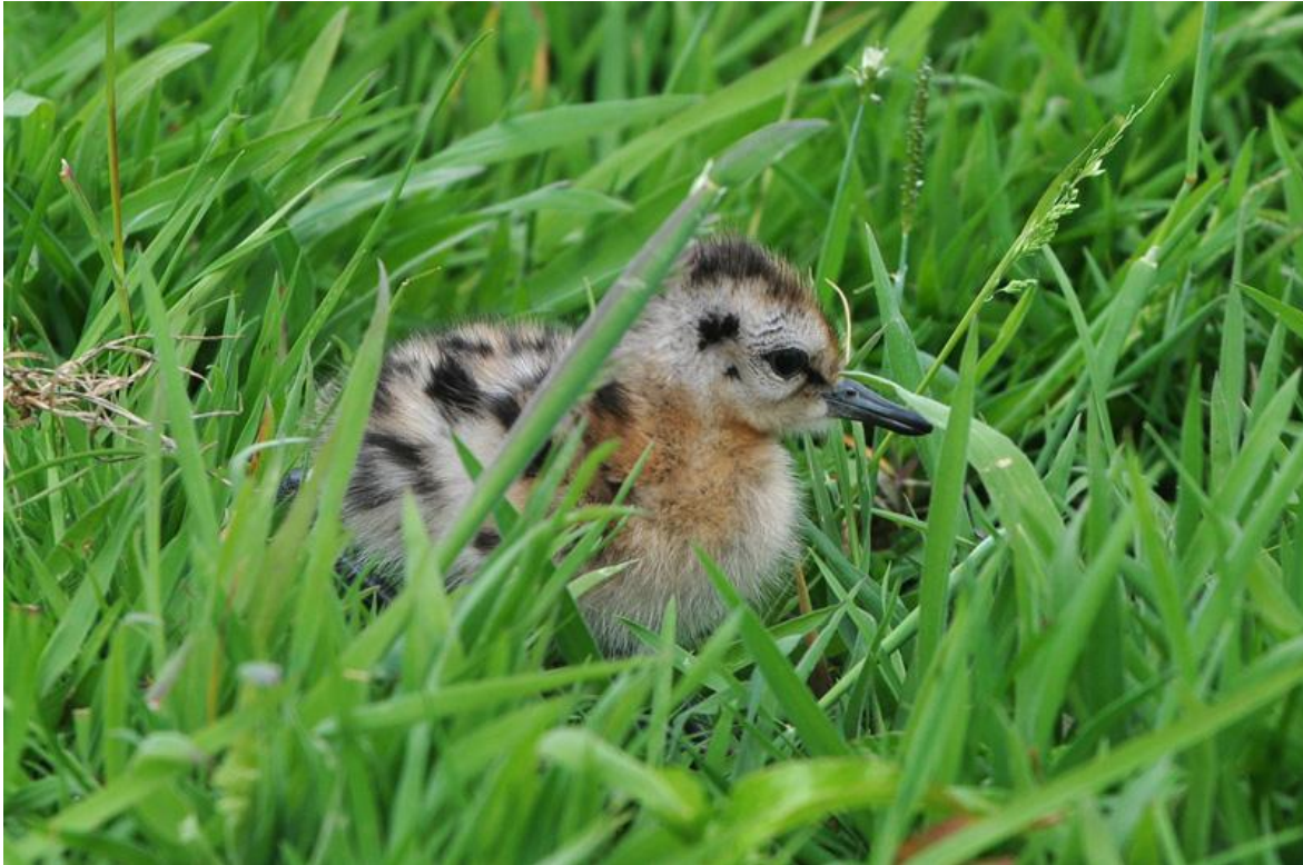
Afbeelding 27. Gruttopul, 22 mei 2011, Grote Westeindsche Polder, Leidschendam, Zuid-Holland.

Verder ringde Maarten enkele kuikens van dakbroedende meeuwen: met name in Leiden, maar dit jaar werd ook een nest in Den Haag geringd, op de Haagse Hogeschool (waarvoor dank). We werden getipt door een studente. Maarten en de toegesnelde Vincent oogstten veel bekijks en het leverde een stukje in het interne medium op. In Westeinde, Leidschendam tot slot ringden Maarten en Vincent weidevogelpullen op een perceel van Staatsbosbeheer. Zie tabel 6 voor het totaal aantal onder de vlag van het VRS geringde vogels buiten Meijndel.