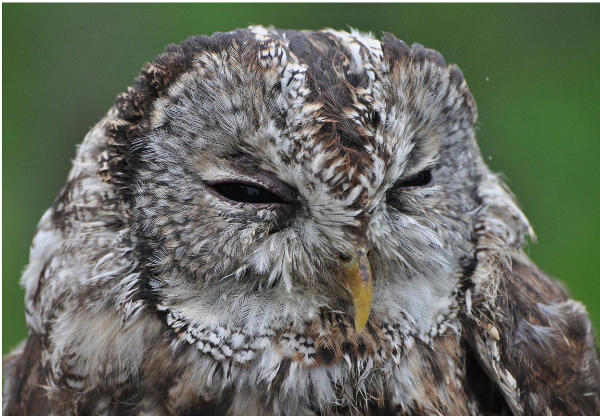
Afbeelding 3: Bosuil, adult: de vierde uilensoort die sinds 2000 in Meijndel is gevangen, Meijndel, Wassenaar, 18 augustus 2011

De benodigde ringvergunningen worden op voorspraak van Het Vogeltrekstation ("Centrum voor Vogeltrek en – demografie") te Wageningen afgegeven door het Ministerie van Economische Zaken, Landbouw & Innovatie. De benodigde terreinvergunningen worden verstrekt door terreinbeheerders Dunea (Meijndel) en Staatsbosbeheer (Duivenvoordse Polder; Westeinde).