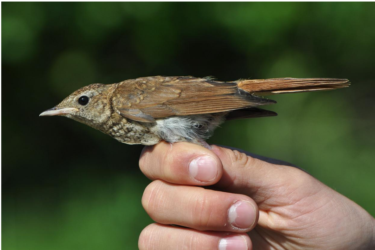
Afbeelding 7. Nachtegaal, juveniel, Meijendel, Wassenaar, 20 juli 2011. Deze vogel is nog grotendeels in juveniel kled. In juli ondergaan de meeste exemplaren een postjuvenile rui, waarna ze meer op adulte vogels lijken.