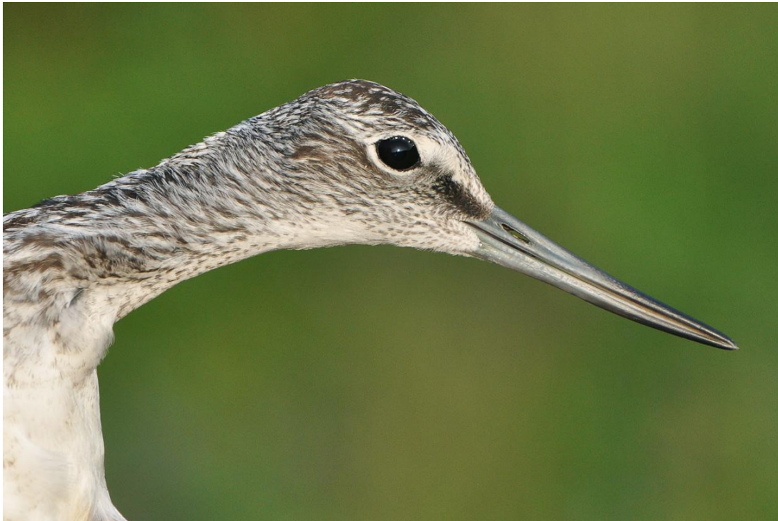
Afbeelding 30. Groenpootruiter, eerstejaars, Meijndel, Wassenaar, 2 augustus 2011

Svensson, L. 1992. Identification guide to European passerines. Stockholm.