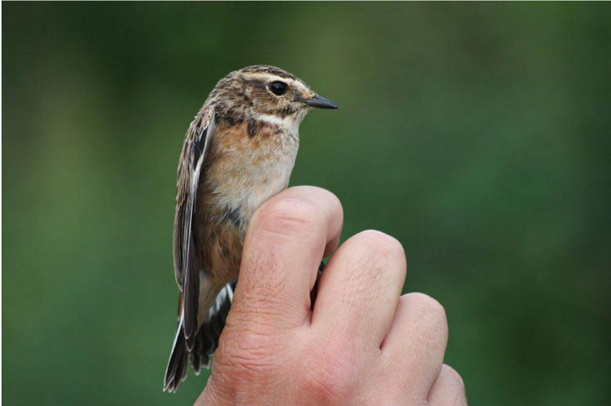
Afbeelding 19: Paapje, eerstejaars, Meijndel, Wassenaar, 23 augustus 2011

Hoewel Paapjes in Meijndel op doortrek niet zeldzaam zijn, zijn ze op de vanglocatie schaars: ze worden in het Sparregat niet jaarlijks geringd. De vogels die op 23 augustus en 2 september gevangen werden, waren de eerste vangsten sinds 2008. Hetzelfde geldt voor de Roodborsttapuit : in de zeereep is het een vrij algemene soort, maar het exemplaar dat op 19 september werd gevangen was eveneens pas de eerste sinds 2008. Ook voor deze beide soorten geldt dat dit wellicht te maken heeft met de verbossing op de vanglocatie. In 2009 en 2010 werden we verwend met goede aantallen Gekraagde Roodstaarten . Dit jaar bleven ze, met 14 vangsten, wat achter.