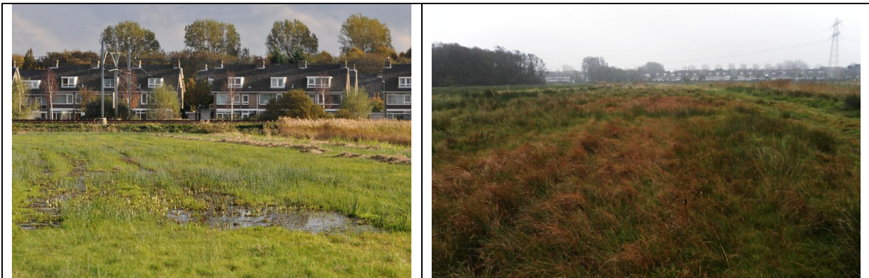
Afbeelding 24-25. Het perspectief is niet hetzelfde, maar het is wel degelijk hetzelfde perceel in de Duivenvoordse Polder. De linkerfoto is genomen op 30 oktober 2010. Op 30 oktober 2011, exact een jaar later, is het perceel volledig verdroogd en verruigd. Bokjes worden hier niet meer waargenomen.

Een goed gesprek met de beheerder (Peter van Osch) zorgde voor een oplossing waar iedereen zich in kan vinden. De greppeluiteinden naar de perceelscheidingen zijn opgehoogd, waardoor aanwezig kwel- en regenwater beter wordt vastgehouden. Wij zijn SBB erkentelijk voor het snel uitvoeren van de in het overleg gemaakte afspraak.