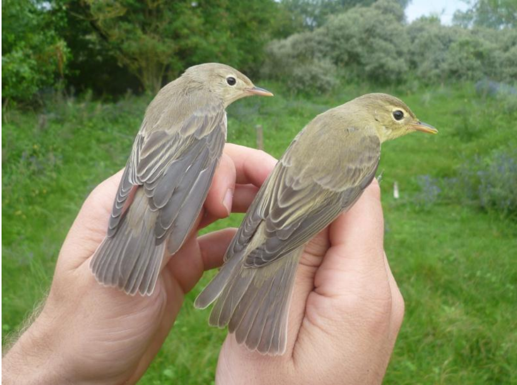
Afbeelding 17: Spotvogels, eerstejaars, Meijendel, Wassenaar, 6 augustus 2011

De trek van Zwartkoppen begon al vroeg, met in de maand augustus al 213 vangsten. Op de 26 e van deze maand werden 72 exemplaren gevangen, waaronder een vogel met een Nederlandse ring. Ook in september bleken ze algemeen, met in totaal 958 nieuw geringde vogels. Vooral de 16 e was goed: 157 vangsten betekende de tweede dag ooit. Wie weet waar de teller was geëindigd als het in de eerste drie weken van september niet zo vaak gestormd had? Uiteindelijk bleek 2011 het op één na beste jaar ooit voor de soort, met een jaartotaal van 1.434. De 'jaarlijkse' Sperwergrasmus hing op 23 augustus in de netten. Zonder uitgesproken topdagen deed ook de Tuinfluiter het behoorlijk, met een jaartotaal van 131 nieuwe vangsten. Op 10 september werd een vogel met Belgische ring gevangen. De zesde Cetti's Zanger sinds 2000 werd op 25 september geringd.