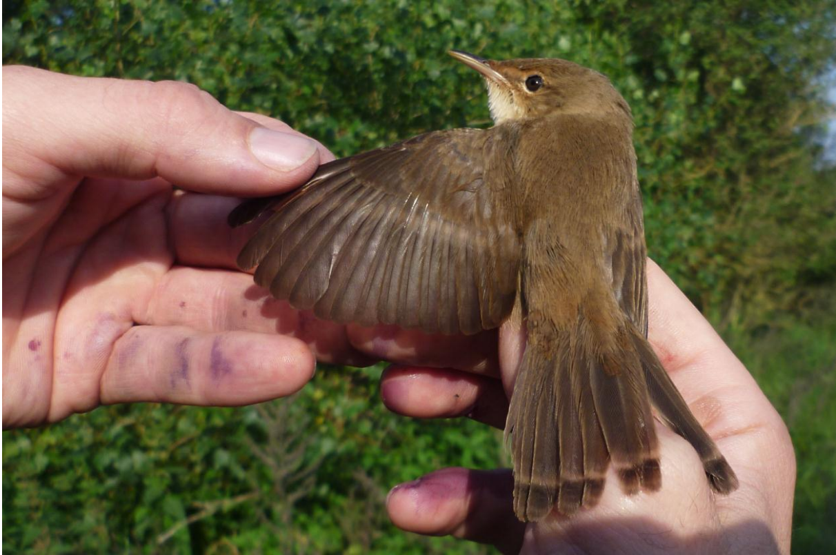
Afbeelding 11: Kleine Karekiet, juveniel met groeistrepen in staart en vleugel, Meijndel, Wassenaar, 2 september 2011