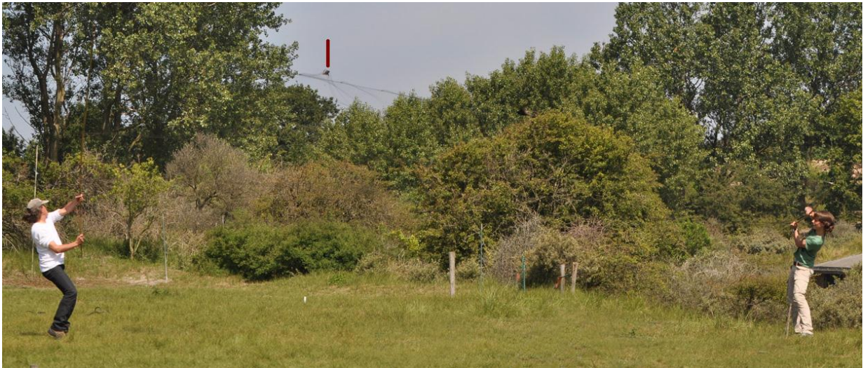
Afbeelding 8: Rinse (l) en Morrison scheppen ('flappen') een Gierzwaluw uit de lucht. Het rode streepje wijst een Gierzwaluw aan die in het net terecht komt. Meijndel, Wassenaar, 5 juli 2011.

Na een voorzichtige proef in 2010 werden dit jaar in juli enkele uitgebreidere pogingen ondernomen om Gierzwaluwen te vangen. En met succes. Tussen 2 en 11 juli werden op vier vangdagen in totaal 30 exemplaren geringd. De beste dag was 5 juli, met 13 vogels. Het vangen gebeurde op twee manieren: met verhoogde mistnetten en door middel van "flappen", waarbij laagvliegende vogels door twee mensen die een mistnet aan de stokken vasthouden als het ware uit de lucht worden geschept (zie afbeelding 8). In totaal werden met de laatstgenoemde methode elf exemplaren verschalkt.